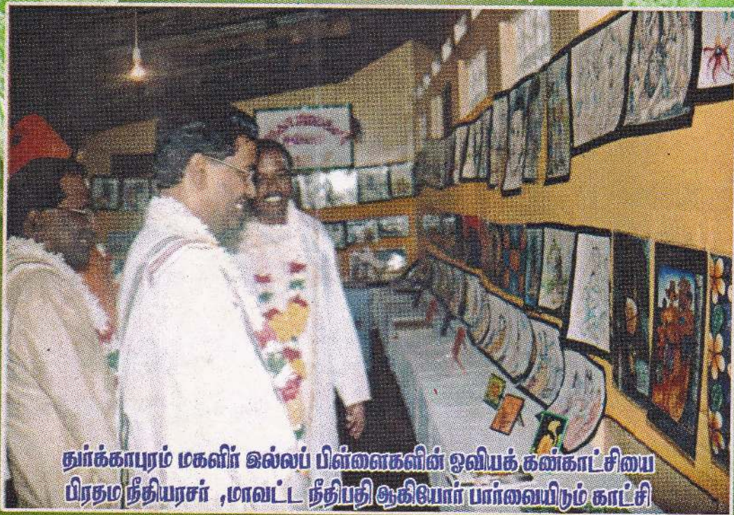
தூர்க்காபுரம் மகலிர் ஁ல்லப் பிள்ளைகளின் ஁வியக் கண்காட்சியை பிரதம நீதியரசர் ,மாவட்ட நீதிபதி ஁கியார் பார்வையிற்ும் காட்சி