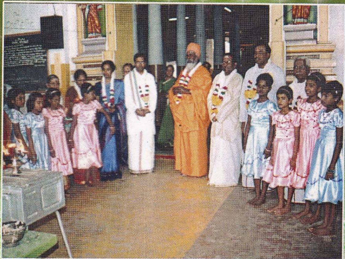
நல்லை ஆதின முதல்வர் பிரதம விருந்தினர் சிறப்பு விருந்தினர்கள் கௌரவ விருந்தினர் சகிதமாக ஆலய முன்னரலில் ஁வ்வலம் ஆரம்பம்