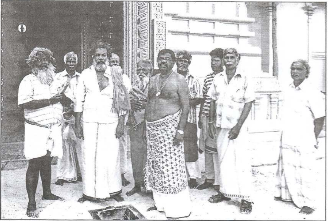
ஆசை புத்தியை மறைக்கும்போது அறிவு வேலை செய்யாமல் போய்விடுகிறது.