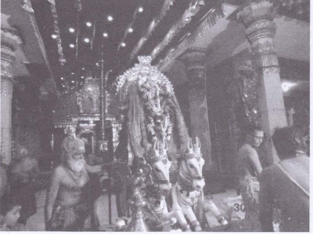
யாவைக்கந்தன் விஜயதசமி நாளில் தூர்க்காதேவி தேவஸ்தானத்துக்கு வருகைதந்த காட்சி