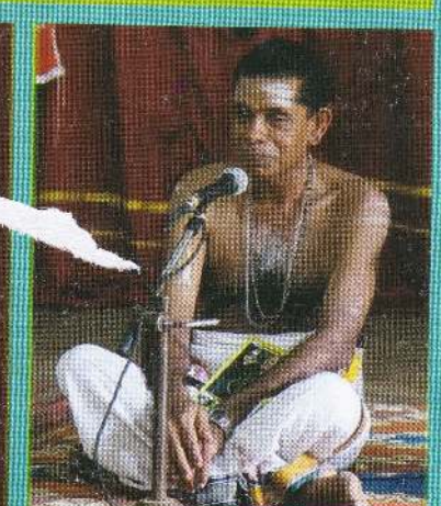
விரிவுரையாளர்களின் சிறப்புச் சொற்பொழிவு