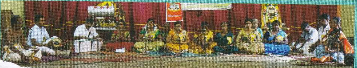
இணைவு திருமுறைப் பயிற்சீமையப் பயிலினர்கள்