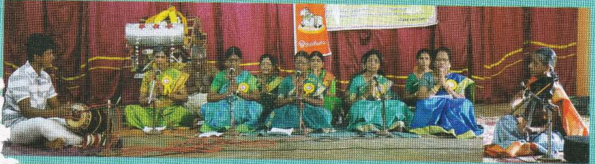
கொழும்புத் திருமுறைப் பயிற்சீமையப் பயிலினர்கள்