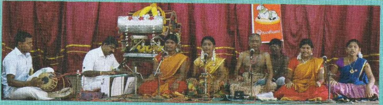
திருமுறை மன்ற மாணவர்கள்