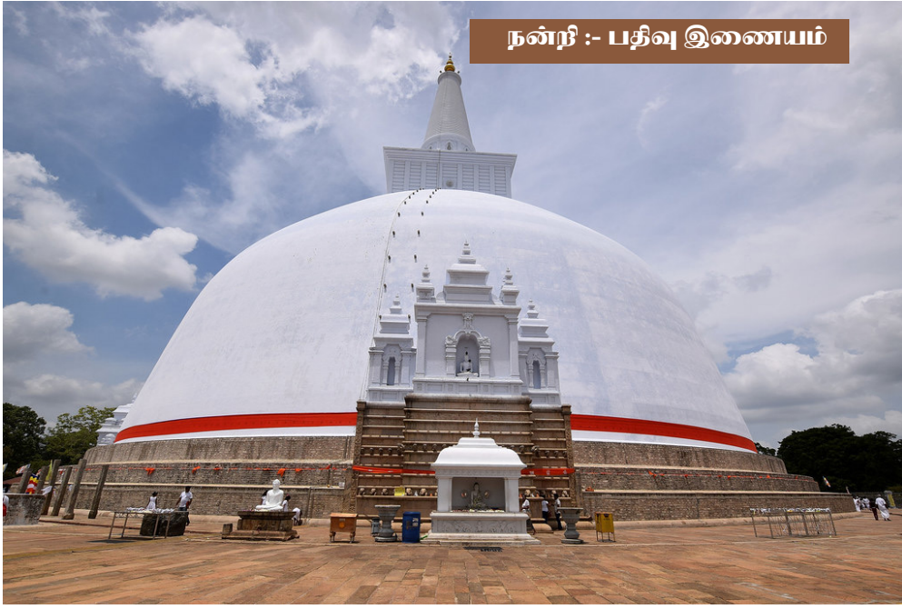
நன்றி :- பதிவு இணையம்

இவ்வாறு கேட்பவனுக்கு என்ன பதில் சொல்வது? தேற்றுவதுதான் எப்படி? ஏனெனில் அவனுள் இந்தக் குரோதமும் விரோதமும் வளரக் காரணமானவர் அவளல்லவா...? தன் மசக்கை ஆசை