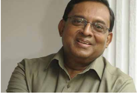
கொழும்பு, நவ. 21 நாட்டில் சிங்கள - பௌத்தத்துக்கு அச்சுறுத்தல் ஏற்பட்டிருப்பதாக எதிரணியினரால்

மாயை ஒன்று உருவாக்கப்பட்டு, அதனுடாக அவர்கள் தேர்தலில் வெற்றியடைந்திருக்கிறார்கள்.