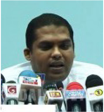
கொழும்பு, நவ. 21 ஐக்கிய தேசியக் கட்சியின் தலைமையிலும், ஏனைய புதவிகளிலும் மாற்றங்கள் நிகழவில்லையென்பது புதிதாக அரசியல் கட்சியொன்றை அமைக்க வேண்டி ஏற்படும் என நாடாளு