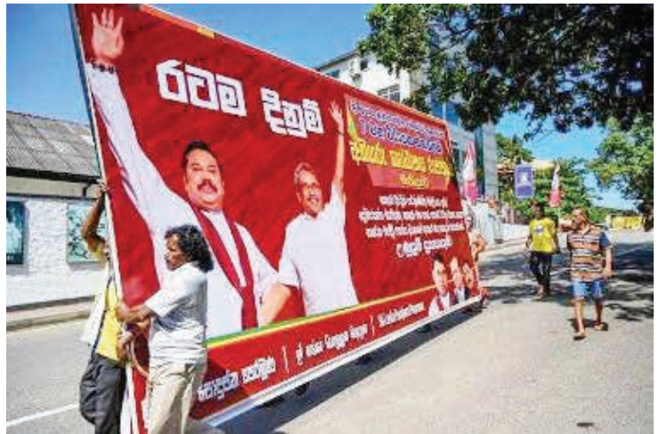
ஸாருக்கு உத்தரவிட்டுள்ளார். இதை யடுத்து இவற்றை அகற்றும் நடவடிக்கைகளில் பொலிஸார் உடனடியாக ஈடுபட்டுள்ளனர் எனவும் தெரிவிக்கப்படுகின்றது.

இலங்கைக்கும் ஐக்கிய இராச்சியத்துக்கும் இடையிலான இரு தரப்பு நல்லுறவைப் பாதுகாக்கும் வகையில் இது குறித்து உரிய நடவடிக்கை எடுக்குமாறு உங்களை வேண்டிக் கொள்கின்றோம் - என்றுள்ளது. (ஐ)