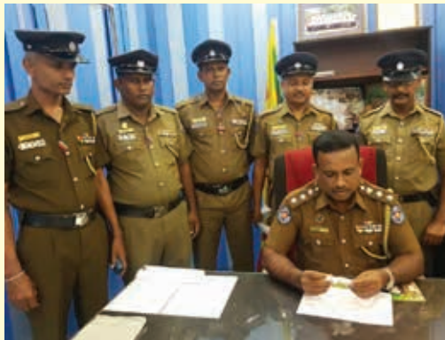
வவுனியா, நவ. 22 வவுனியாவில் ஐம்பதின்மூன்று ரூபா பெறுமதியான ஹெரோயின் போதைப் பொருளுடன் ஒருவர் நேற்றுக் கைது செய்ய

யப்பட்டுள்ளார் என வவுனியா பொலிஸ் நிலையப் பொறுப்பதிகாரி தெரிவித்தார்.