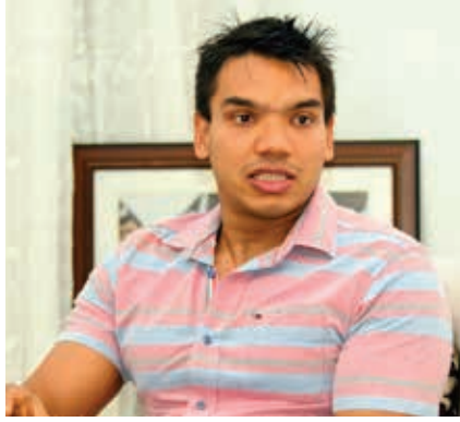
சுறினார். ஒரு சந்தர்ப்பத்தில் இலங்கை, இந்தியா, சீனா ஆகிய நாடுகள் மத்தியிலான உறவுகள் குறித்து பிழையாக அர்த்தப்படுத்தப்பட்டதுடன் தலைவர்களுக்கும் பிழையான செய்தி தெரிவிக்கப்பட்டது என அவர் குறிப்பிட்டுள்ளார்.

இந்திய ஊடகமொன்றுக்கு கருத்து தெரிவிக்கையிலேயே அவர் இவ்வாறு