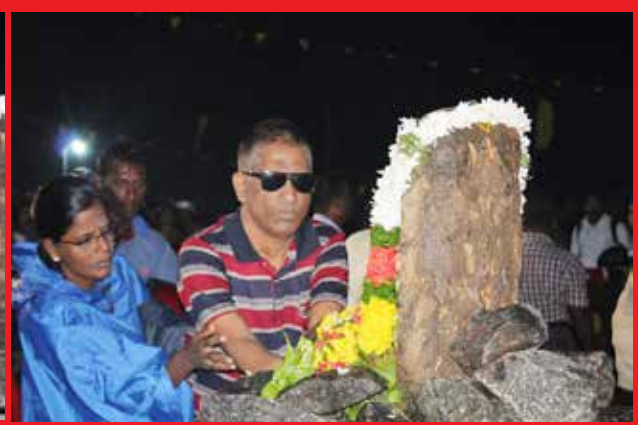
கோப்பாய் துயிலும் இல்லத்தில்.....