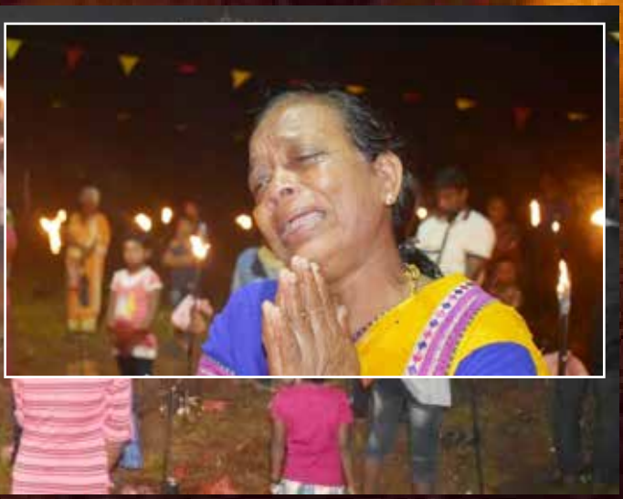
முல்லைத்தீவு ஆலங்குளம் துயிலும் இல்லத்தில்.....