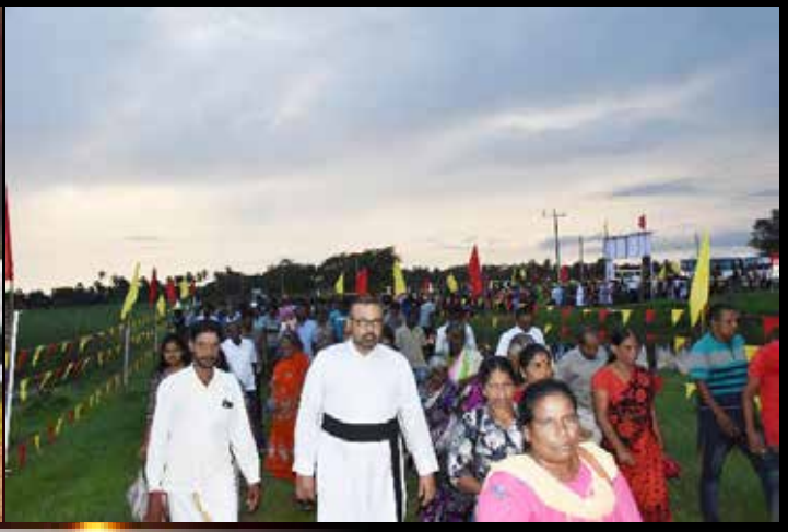
ஆட்காட்டிவெளி துயிலும் இல்லத்தில்....