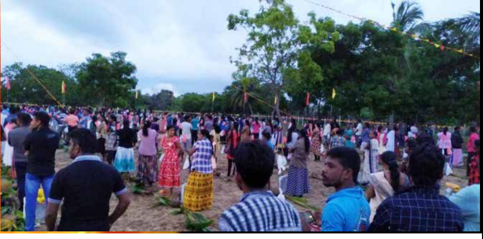
வாகரை கண்டலடி துயிலும் இல்லத்தில்.....