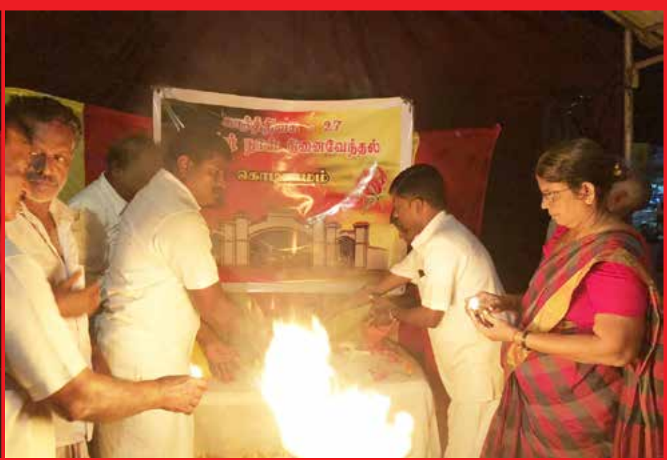
கொடகாமம் துயிலும் இல்லத்தில்.....