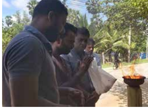
யாழ்ப்பாணம், நவ. 28 கொடிகாமம் மாவீரர் துயிலுமில்லம் அமைந்துள்ள பகுதியில் மாவீரர்களுக்கு அஞ்சலி செலுத்துவதற்காகச் சுடரேற்ற முற்பட்டபோது