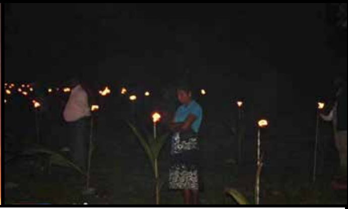
பண்டுவிரிச்சான் துயிலும் இல்லத்தில்.....