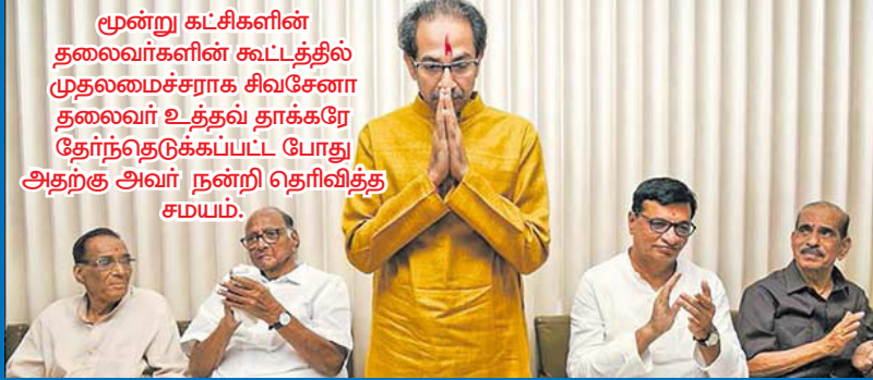
மூன்று கட்சிகளின் தலைவர்களின் கூட்டத்தில் முதலமைச்சராக சிவசேனா தலைவர் உத்தவ் தாக்ரே தேர்ந்தெடுக்கப்பட்ட போது அதற்கு அவர் நன்றி தெரிவித்த சமயம்.

டும் என்று கூட்டளையிட்டது. ஆனால் திடீர்திருப்பமாக துணை முதல்வர் பதவியில் இருந்து அஜித் பவார் நேற்று முன்தினம் மாலை பதவி விலகினார். தொடர்ந்து தேவேந்திர பட்னாவிஸும் பதவி விலகினார். அஜித் பவார் விலகிய தால், பெரும்பான்மை தங்களுக்கு இல்லை என்பதாகவும் தேவேந்திர பட்னாவிஸ் தெரிவித்தார்.