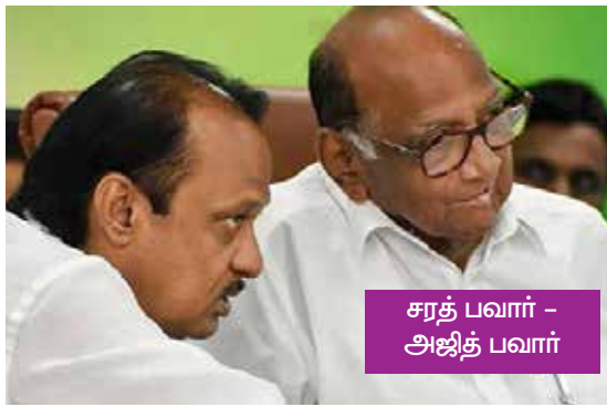
சரத் பவார் - அஜித் பவார்

சரத்பவார் மனைவி, மகள், மருமகன் உள்பட குடும்பத்தினரின் உருக்கமான பேச்சால் அஜித் பவார் துணை முதலமைச்சர் பதவியை ராஜினாமா செய்து கட்சிக்கு திரும்பியதாக தகவல் வெளியாகி உள்ளது.