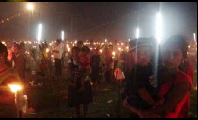
வன்னிவிளாங்குளம் துயிலும் இல்லத்தில்.....