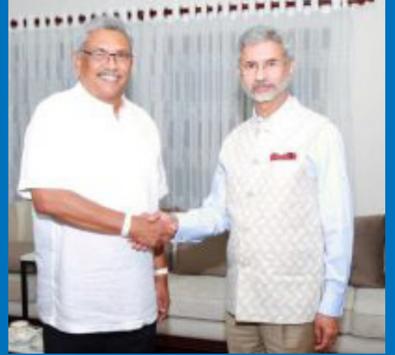
அந்த வாக்குறுதியை நாங்கள் கவனிக்கவேண்டும். என்று அவர் குறிப்பிட்டார்.

இதன்போது, தான் இப்போது அனைத்து இலங்கையர்களுக்கும் ஜனாதிபதியாக இருப்பதாக கோட்டாபய ராஜபக்ஷ எம்மிடம் உறுதி அளித்தார்.