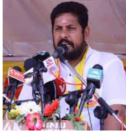
கல்முனை வடக்கு பிரதேச செயலகம் தரமுயர்த்தப்படுகின்ற விடயம் தொடர்பாக நாங்கள் பல தரப்பட்ட பேச்சுக்களில் கலந்துகொண்டு நாடாளுமன்றத்திலும் குரல் கொடுத்தோம்.

தமிழ்த் தேசியக் கூட்டமைப்பு, தமிழர்களின் பலம் என்பதைத் தமிழ் மக்கள் ஒருபோதும் மறந்துவிடக்கூடாது.