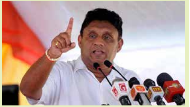
கடத்தப்பட்டமை இராஜதந்திர உறவுகளின் வரலாற்றில் கறுப்பு நாள் எனவும் சஜித் குறிப்பிட்டுள்ளார்.

அத்தோடு இந்தச் சம்பவங்கள் தொடர்பாக பக்கசார்ப்பற்ற விசாரணை வேண்டும் என்றும், தூதரக அதிகாரி