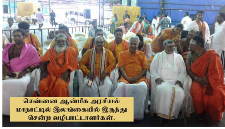
சென்னை ஆன்மிக அரசியல் மாநாட்டில் இலங்கையில் இருந்து சென்ற வழிபாட்டாளர்கள்.

தமிழகத்தில் திராவிட அரசியலுக்கு மாற்றாக, தேசிய அரசியலை, ஆன்மிகம் சார்ந்த வளர்ச்சி அரசியலை கொண்டு வருவதற்காக இந்த மாநாடு நடத்தப்படுகிறது. தமிழகத்தில் பல்வேறு வளர்ச்சி திட்டங்களை மத்திய அரசு கொண்டு வருகிறது. ஆனால் அவற்றை வரவிடாமல் தடுக்கின்றனர். தமிழகத்தையும், தமிழர்களையும் வஞ்சிக்கும் அரசியலுக்கு மாற்றாக, வளர்ச்சி அரசியலை, ஆன்மிக அரசியலை முன்னிறுத்துவதே எங்கள் நோக்கம். அதேபோல் செயின்ட் ஜோர்ஜ் கோட்டையை, வள்ளுவன் கோட்டையாக மாற்றுவதற்காகவே இந்த மாநாடு நடத்தப்படுகிறது.