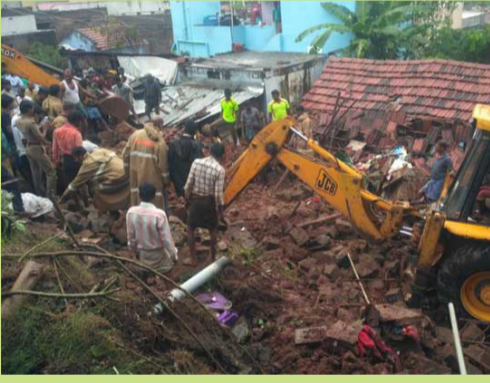
மேட்டுப்பாளையம், டிசெ. 03

கோவை மேட்டுப்பாளையம் அருகே மழையால் வீடுகளின் மீது கொம்புவண்டி சுவர் இடிந்து விழுந்ததி் பெண்கள், குழந்தைகள் உள்ளிட்ட 17 பேர் உயிரிழந்தனர்.