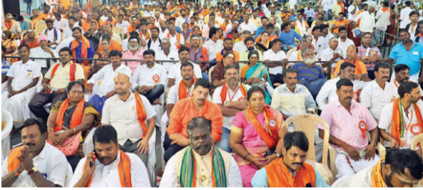
சென்னை, டிசெ. 03

'தமிழகத்தில் 2021ம் ஆண்டு சட்டசபை தேர்தலில் ஆன்மிக அரசியல் எழுச்சி பெறுவதன் மூலம் அற்புதமும், அதிசயமும் நடக்கும்' என்று சென்னையில் நேற்று முன்தினம் நடந்த ஆன்மிக அரசியல் மாநாட்டில் இந்து மக்கள் கட்சி தலைவர் அர்ஜுன் சம்பத் கூறினார்.