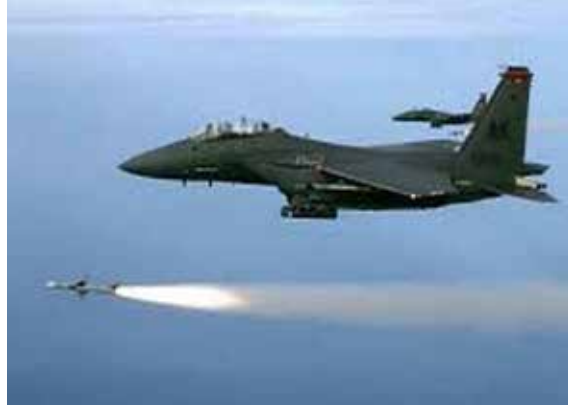
இதேபோன்று ஹெல்மாண்ட் மாகாணத்தில் நாஹர் இ சரஜ் மாவட்டத்தில் நடத்தப்பட்ட வான்தாக்குதலில் 6 தீவிரவாதிகள் கொல்லப்பட்டனர்.

இதையடுத்து காந்தகார் மாகாணத்தில் நேஷ் மாவட்டத்தில் தலீபான்கள் மறைவிடத்தைக் குறிவைத்து இராணுவ விமானங்கள் வியாழன்று குண்டு வீச்சு நடத்தின. இதில் 9 தலீபான் தீவிரவாதிகள் பலியாகினர்.