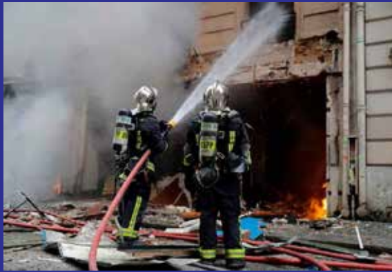
அவர்களில் சிலர் பலத்த தீக்காயம் அடைந்திருப்பதால் சாவு எண்ணிக்கை மேலும் அதிகரிக்கலாம் என அஞ்சப்படுகிறது.

திருமண ஏற்பாடுகள் தட்புடலாக நடந்து கொண்டிருந்த வேளையில், திடீரென அங்கிருந்த எரிவாயு சிலிண்டர் வெடித்துச் சிதறியதால் தீ விபத்து ஏற்பட்டது. கண் இமைக்கும் நேரத்தில் நடந்த இந்த விபத்தில் அங்கு வந்திருந்த உறவினர்களில் 11 பேர் சம்பவ இடத்திலேயே உடல் கருகி பரிதாபமாக உயிரிழந்தனர். மேலும் படுகாயம் அடைந்த 30 பேர் மருத்துவமனையில் அனுமதிக்கப்பட்டனர்.