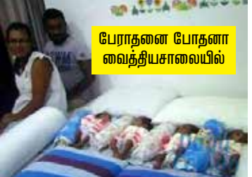
பேராதனை போதனா வைத்தியசாலையில் நான்கு பிள்ளைகளும் அவர்களது வீட்டுக்குச் சென்றுள்ளன எனவும்,

பேராதனை போதனா வைத்தியசாலையில் இந்தக் குழந்தைகள் பிறந்துள்ளனர். தற்பொழுது