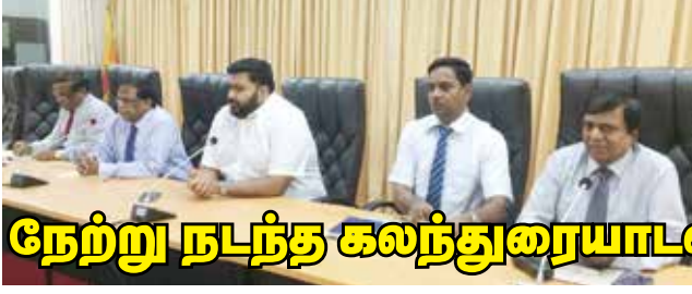
நேற்று நடந்த கலந்துரையாடலில் தீர்மானம்

யாழ்ப்பாணத்தில் அண்மைக் காலமாக அதிகரித்து வரும் டெங்கு தொடர்பான அவசர கலந்துரையாடல் யாழ். மாவட்ட செயலகத்தில் நேற்று நடைபெற்றது.