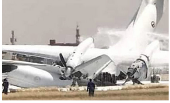
விமானங்கள் மோதி விபத்துக்குள்ளானமையை அடுத்து முன்னெச்சரிக்கை நடவடிக்கையாக விமான நிலையம் மூடப்பட்டது. சர்வதேச விமானங்கள் போர்ட் சூடான் விமான நிலையத்திற்கு திருப்பி விடப்பட்டன. இந்த விபத்து தொடர்பான விடியோ சமூக வலைத்தளத்தில் வெளியாகி உள்ளது.

சூடான் விமான நிலையத்தில் இரண்டு ராணுவ விமானங்கள் மோதி விபத்துக்குள்ளானதால் விமான சேவை பாதிக்கப்பட்டுள்ளது. சூடான் நாட்டின் தலைநகர் சர்ட்டூபில் உள்ள பிரதான விமான நிலையத்தில் இருந்து ராணுவ போக்குவரத்து விமானங்கள் இயக்கப்படுகின்றன. அந்த வகையில் நேற்று முன்தினம் இரண்டு ராணுவ போக்குவரத்து விமானங்கள் இந்த விமான நிலையத்தில் தரையிறங்கும்போது ஒன்றுடன் ஒன்று மோதி விபத்துக்குள்ளாகின. ஒரு விமானம் தரையிறங்கி ஓட்டப்பாதையில் வேகமாக சென்றபோது, அதன் வால் பகுதியில் மற்றொரு விமானம் மோதியது. இதில் இரண்டு விமானங்களும் கடுமையாக சேதம் அடைந்தன. இந்த விபத்தில் அதிர்ஷ்டவசமாக உயிர்ச்சேதம் ஏதும் ஏற்படவில்லை. ஆனால், 8 பேர் காயமடைந்துள்ளனர் என உள்ளூர் இணையதளத்தில் செய்தி வெளியாகியுள்ளது.