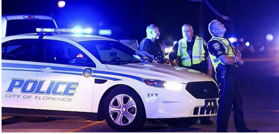
நோக்கித் துப்பாக்கிச் சூடு நடத்தினார்.

வொஷிங்டன், ஒக். 06 அமெரிக்காவில் உள்ள தெற்கு கரோலினாவில் மர்ம நபர் ஒருவர் பொலிஸாரை நோக்கிச் துப்பாக்கிச் சூடு நடத்தியதில் 6 பொலிஸார் படுகாயம் அடைந்தனர், ஒரு அதிகாரி பரிதாபமாக உயிரிழந்துள்ளார்.