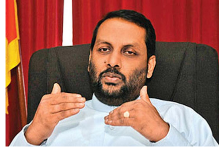
ஆலோசனை வழங்கியுள்ளார். நமது நாட்டில் உற்பத்தி செய்யப்பட்ட பாரம்பரிய பலவகையான நெல்கள் முன்

வவுனியா மாவட்டத்தில் கைவிடப்பட்ட 550 நெற்காணியில் பழமைவாய்ந்த தும் போசாக்கு நிறைந்ததுமான நெல் வகைகளை உற்பத்தி செய்வதற்கு விவசாய அமைச்சர், விவசாய அபிவிருத்தி திணைக்களம், விவசாய திணைக்களம் ஆகியன நடவடிக்கைகள் மேற்கொண்டுள்ளன. இதற்கான உரியநடவடிக்கைகளை மேற்கொள்ளுமாறு அமைச்சர் மஹிந்த அமரவீர அதிகாரிகளுக்கு