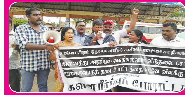
யாழ்ப்பாணம், ஒக். 09 அரசியல் கைதிகளின் விடுதலையை வலியுறுத்தியும், உண்ணாவிரதப் போராட்டத்தில் ஈடுபட்டுவரும் அரசியல் கைதிகளுக்கு ஆதரவு பக்கம் 14 >>>