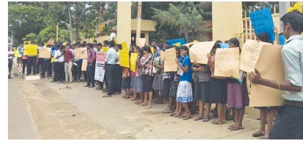
யாழ்ப்பாணம், ஒக். 09 அனைத்து அரசியல் கைதிகளையும் விடுதலை செய்ய வேண்டுமெனவும் பயங்கரவாதத் தடைச்சட்டத்தை இரத்துச் செய்ய வேண்டு பக்கம் 14 >>>