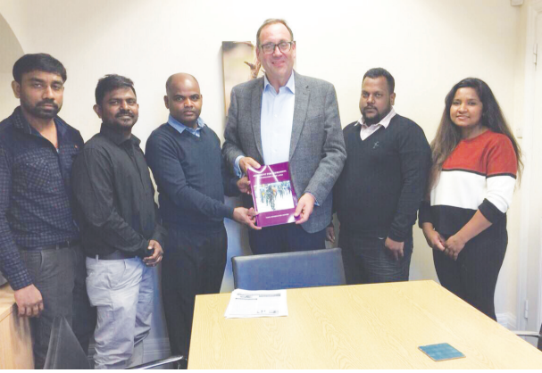
லண்டன், ஒக். 09

இந்த மனுவில் இதுவரை 26 நாடாளுமன்ற உறுப்பினர்கள் கையொப்பமிட்டுள்ளமை குறிப்பிடத்தக்கது. (ஐ)