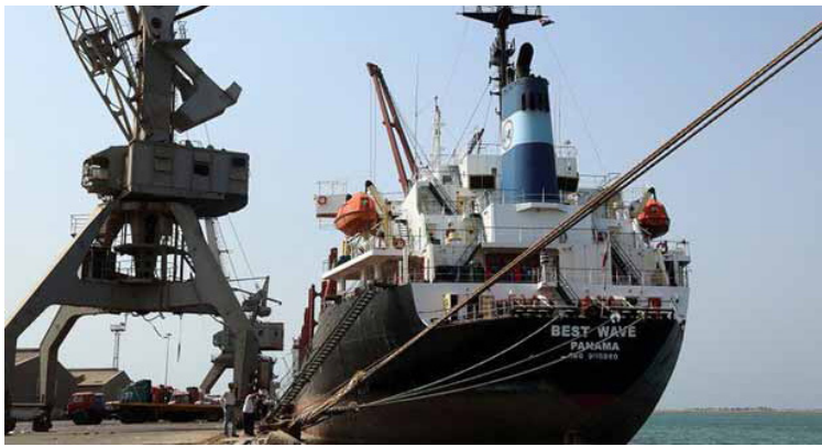
ஹொடைடா மாகாணத்துக்குப் பட்ட அணைத்து பகுதிகளையும் மீட்கும் நோக்கத்தில் சவுதி அரேபியா தலைமையிலான அமீரகப் படைகள் சமீபத்தில் அங்கு முற்று

களது கட்டுப்பாட்டில் வைத்துள்ளனர். மக்களால்தேர்ந்தெடுக்கப்பட்ட அரசுக்கு எதிராக மற் றொரு போட்டி அரசை நடத்திவரும் இவர்கள மீது உள்நாட்டுப்படைகளும் அண்டை நாடான சவுதி அரேபியா தலைமையிலான நேசநாட்டுப்படைகள் தொடர் தாக்குதல் நடத்தி வருகின்றன. அந்த நாட்டின் இரண்டாவது பெரிய துறைமுகம் அமைந்துள்ள ஹொடைடா மாகாணத்தில் ஹவுத்தி போராளிகளின் ஆதிக்கம் செலுத்தி வருகின்றனர். இவர்களுக்கு ஈரான் அரசு மறைமுகமாக ஆயுத உதவிகளை அளித்து வருவதாக குற்றம் சாட்டப்படுகிறது.