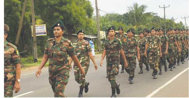
வவுனியா, ஒக். 09

இலங்கை இராணுவத்தின் 69 ஆவது ஆண்டு நிறைவை முன்னிட்டு அணிவகுப்பு நிகழ்வு ஒன்று வவுனியாவில் இடம்பெற்றது.