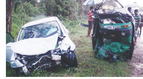
வவுனியா, ஒக். 12 வவுனியா ஹொரவப்பொத்தாத்தானை வீதியில் ஒட்டோ - கார் நேருக்கு நேர் மோதி விபத்துக்குள்ளானதில் பக்கம் 11 >>>