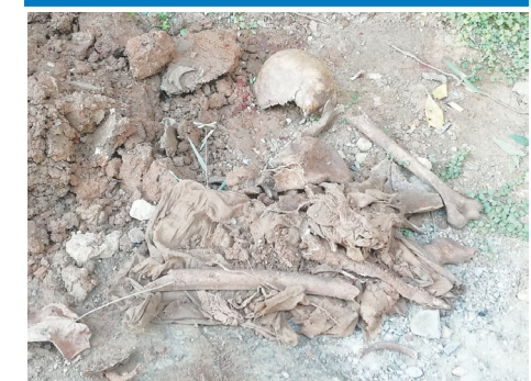
(எஸ்.நிதர்வுன்) யாழ்ப்பாணம், ஒக். 12 அச்சுவேலிப் பகுதியில் மின் கம்பம் நாட்டுவதற்கு நிலத்தைத் தோண்டியபோது மனிதஎலும்புக் கூடுகள் கண்டுபிடிக்கப்பட்டமையால் அப்பகுதியில் நேற்றுப் பெரும் பரபரப்பு ஏற்பட்டது. பக்கம் 11 >>>