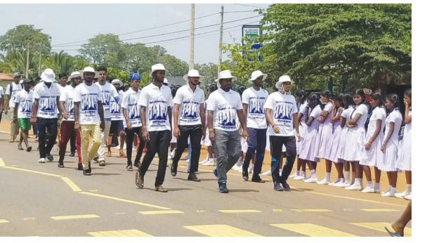
வவுனியா, ஒக். 11 அரசியல் தீர்மானம் எடுத்து அனைத்து அரசியல் கைதிகளையும் நிபந்தனை இன்றி விடுதலை செய்யுமாறு வலியுறுத்தியும், அந்நூராதபுரம் சிறைச்சாலையில் அரசியல் கைதிகள் மேற்கொண்டு வரும் உண்ணா விரதப் போராட்டத்திற்கு வலுச் சேர்க்கும் வகையிலும் யாழ். பல்கலைக்கழக மாணவர்கள் பக்கம் 11 >>>