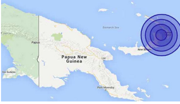
பிரிட்டனின் கிம்பே தீவில் இருந்து கிழக்கே 125 கிலோமீட்டர் தொலைவில் உள்ள இடத்தை

போர்ட் மோர்ஸ்பை, ஒக்.12 பசிபிக் தீவு நாடான பப்புவா நியூ கினியாவின் போர்கேரா மாகாணத்தில் நேற்று சக்தி வாய்ந்த நிலநடுக்கம் ஏற்பட்டது. இந்த நிலநடுக்கம் ரிச்டர் அளவு கோலில் 7 ஆக பதிவானதாக அமெரிக்க புவிமியல் ஆய்வு மையம் தகவல் வெளியிட்டுள்ளது.