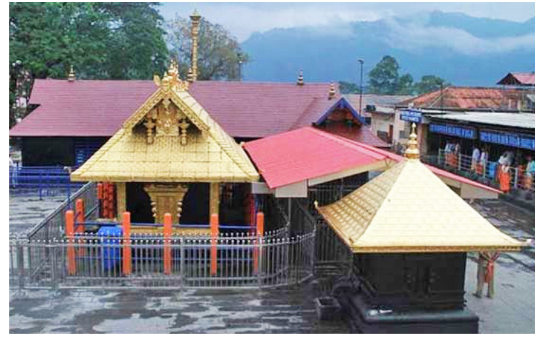
வருகின்றன. கம்யூனிஸ்ட் கட்சிகள் தவிர பா.ஜ.க.காங்கிரஸ் உள்பட அனைத்து கட்சியினரும், பெண்கள் அமைப்பினரும் போராட்டங்களில் பங்கேற்று வருகின்றனர்.

மேலும் கேரளா முழுவதும் பேரணி, ஆர்ப்பாட்டங்கள் நடந்து