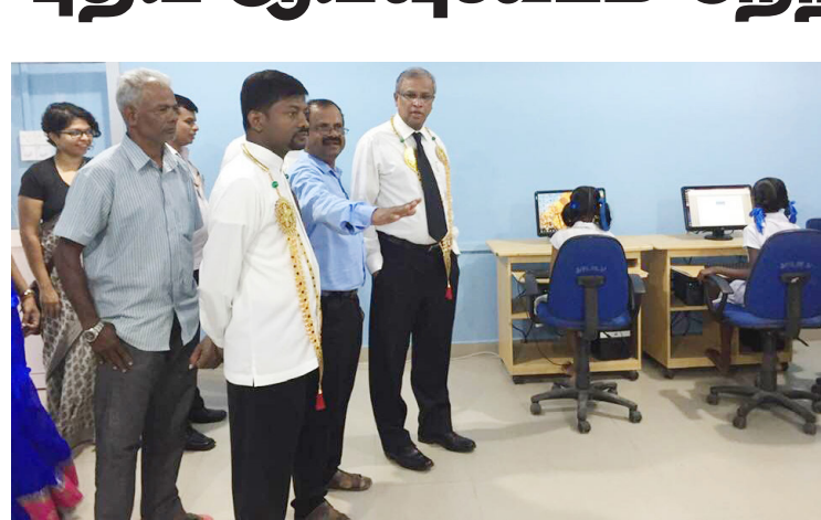
யாழ்ப்பாணம், ஒக். 17 நாவற்குழி மகா வித்தியாலயத்தில் புதிதாக அமைக்கப்பட்ட மாணவர்களுக்கான ஆய்வுகூடம் நேற்றுக் காலை திறந்து வைக்கப்பட்டது. வடக்கு மாகாண சபையின் உறுப்பினர் கேசவன்சயந்தனின் ஏற்பாட்டில் யாழ். மாவட்ட நாடாளுமன்ற உறுப்பினர் எம். ஏ. சுமந்திரனின் 2017 ஆம் ஆண்டுக்கான கிராமிய உட்கட்டமைப்பு அபிவிருத்தி விசேட நிதி ஒதுக்கீட்டில் இந்த ஆய்வுகூடம் அமைக்கப்பட்டது. இந்த ஆய்வுகூடத் திறப்பு விழா நிகழ்வு நேற்றுக் காலை பாடசாலை அதிபர்தலைமையில் நடைபெற்ற போது கூட்டமைப்பின் நாடாளுமன்ற உறுப்பினர் சுமந்திரன் விருந்தினராகக் கலந்து கொண்டு ஆய்வு கூட்டத்தைத் திறந்து வைத்தார். இந்த நிகழ்வில் மாகாண சபை உறுப்பினர் சயந்தன், பாடசாலை அதிபர், ஆசிரியர்கள், மாணவர்கள் எனப் பலரும் கலந்து கொண்டிருந்தனர். (ஐ)