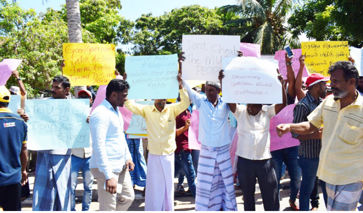
மன்னார் முசலிப் பிரதேச செயலாளரை உடன்மாற்றக்கோரி முசலிப் பிரதேச மக்கள் சார்பாகச் சிலர் மன்னார் மாவட்ட செயலகத்துக்கு முன்பாக ஆர்ப்பாட்டத்தில் இறங்கியமையுடன் மன்னார் மாவட்ட அரசு அதிபரிடம் மகஜர் ஒன்றையும் கையளித்தனர்.

நேற்றுச் செவ்வாய் கிழமை காலை 10 மணி தொடக்கம் மன்னார் மாவட்ட செயலகத்துக்கு முன்பாக ஒன்று திரண்ட முசலி பிரதேசத்தைச் சார்ந்த முஸ்லிம் மக்கள் இந்த ஆர்ப்பாட்டத்தில் ஈடுபட்டனர். சுமார் ஒரு மணி நேரம் நடைபெற்ற இந்த ஆர்ப்பாட்டத்தின்போது மக்கள் தங்கள் கைகளில் முசலிப் பிரதேச செயலாளருக்கு எதிரான வாசகங்களைக் கொண்ட பதாகைகளை ஏந்திக் கொண்டு கோஷங்களை எழுப்பினர். இதைத் தொடர்ந்து மன்னார் மாவட்ட அரசு அதிபரிடம் மகஜர் ஒன்றும் கையளிக்கப்பட்டது.