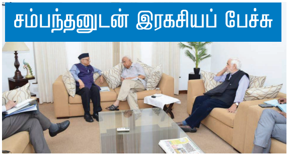
சம்பந்தனுடன் இரகசியப் பேச்சு

கொழும்பு, நவ. 02 இலங்கையில் பிரதமர் ரணில் விக்கிரமசிங்கவா? மஹிந்த ராஜபக்ஷவா? என்ற குழப்ப நிலை சர்வதேச ரீதியில் கூடுபிடித்துள்ளதையடுத்து இதற்கு முடிவு கட்டும் வகையில் இந்தியாவும் நேரில் களமிறங்கியுள்ளது. பக்கம் 11 >>>