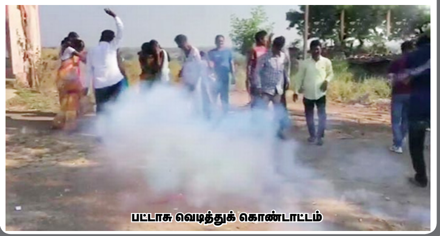
பட்டாசு வெடித்துக் கொண்டாட்டம்

நேற்று முன்தினம் நள்ளிரவு அடர்ந்த வனப்பகுதியில் அந்த புலியை சுட்டுக் கொன்றனர். எனினும், இரண்டு குட்டிகள் குறித்து எந்தத் தகவலும் வெளியிடப்படவில்லை. ஆவ்னி புலி கொல்லப்பட்டது பற்றி வனத்துறையினர் எந்த விளிவான தகவலை வெளியிட வில்லை. இந்த தகவல் வெளியானதும் வனப்பகுதியைச் சேர்ந்த கிராம மக்கள் பட்டாசு வெடித்து கொண்டாட்டங்களில் ஈடுபட்டனர்.