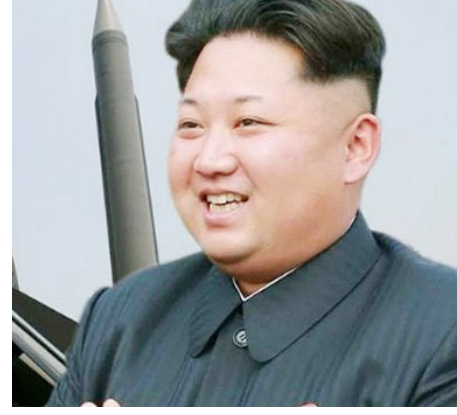
சிப் பாதைக்கு திரும்பப் போவதாக வட கொரியா எச்சரித்துள்ளது.

இந்நிலையில், அமெரிக்கா தனது நிலைப்பாட்டை மாற்றிக்கொள்ளாவிட்டால் தங்கள் நாட்டின் 'பியாங்ஜின்' (pyongjin) கொள்கைப்படி அணு ஆயுத பலத்தை அதிகரிப்பதன் மூலம் பொருளாதார வளர்ச்சி