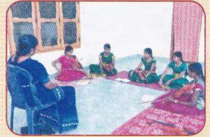
துர்க்காபுரம் மாணவிகளின் ஆக்கத்திறன் செயற்பாடுகள் மற்றும் கல்விச் செயற்பாடுகள்