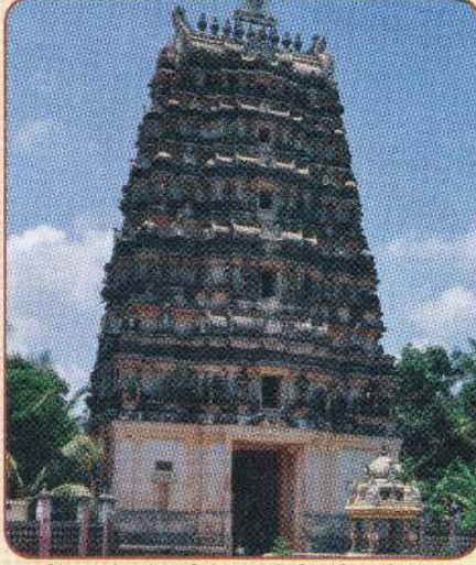
மாவிட்டபுரம் கந்தனின் அருள்மிகு திருக்கோபுரம்