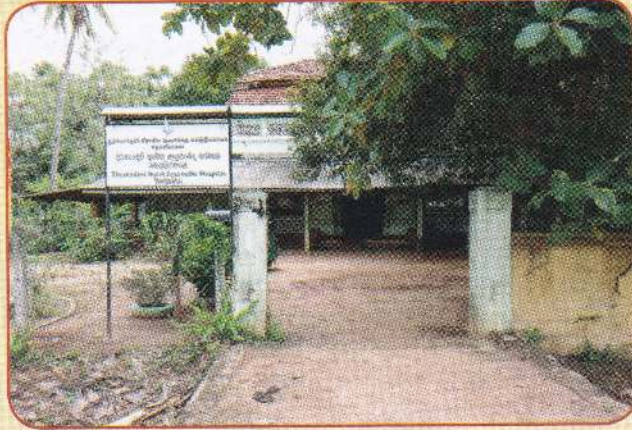
துர்க்காபுரம் ஆயுர்வேத வைத்தியசாலை

முதன் முதலாக யாழ்ப்பாணத்தில் சித்த ஆயுர்வேத வைத்தியசாலையை ஆலய வளாகத்தில் நிறுவிய பெருமை துர்க்காதேவி தேவஸ்தானத்திற்கு உரியது. வடமாகாண சித்த ஆயுர்வேத திணைக்களத்தின் அனுமதியுடன் ஆலய தர்மகர்த்தாசபை உறுப்பினர் ஒருவரது இருமாடிவீட்டை தேவஸ்தானம் வைத்தியசாலைக்காக பயன்படுத்திவருகிறது. இந்த வைத்தியசாலை இருபத்து நான்கு மணிநேரமும் இயங்குவதுடன் நோயாளிகள் தங்கியிருந்து சிகிச்சை பெறக்கூடிய வசதிகளும் செய்யப்பட்டுள்ளன.