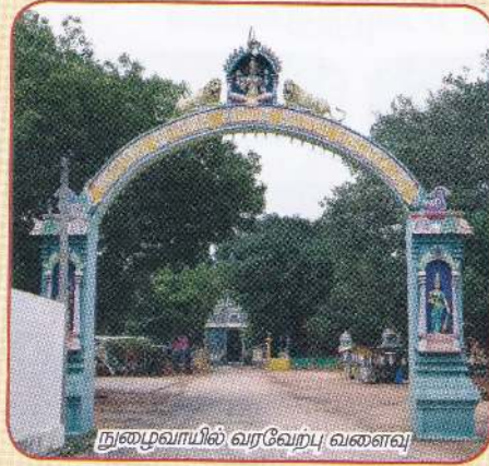
நுழைவாயில் வரவேற்பு வளைவு