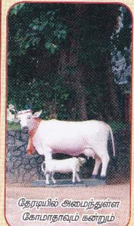
தேரடியில் அமைந்துள்ள கோமாதாவும் கன்றுமும்