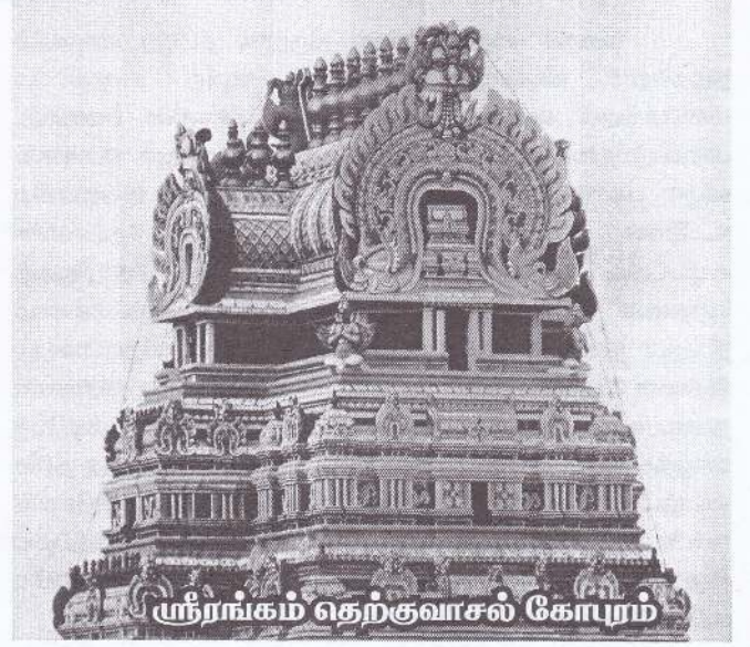
ஸ்ரீரங்கம் தெற்குவாசல் கோபுரம்

அண்மைக் காலத்தில் ராஜகோபுர வரலாற்றில் குறிப்பிடத்தக்க அமைப்பு ஸ்ரீரங்கம் இராஜகோபுரமாகும். ஆசியாவிலேயே உயரமான கோபுரமென புகழத்தக்க பெருமைகொண்டது. அடியார்களைக் கருவியாக்கி அரக்கன்