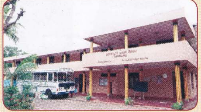
துர்க்காபுரம் மகளிர் இல்லம்