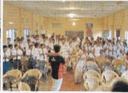
மட்டக்களப்பு, காரைதீவு இராமகிருஷ்ண பெண்கள் வித்தியாலயத்தில் நடைபெற்ற நிகழ்வு