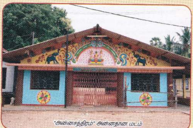
"அன்னசத்திரம்" அன்னதான மடம்