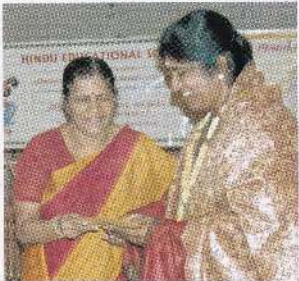
யோகபுரம் ஸ்ரீ சுப்பிரமணியர் ஆலயத்துக்கான 100,000 ரூபா நன்கொடை பாராளுமன்ற உறுப்பினருடாக வழங்கப்பட்டது.