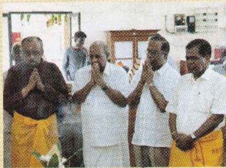
மாண்புமிகு பிரதம நீதியரசர் க. ஸ்ரீபவன் அவர்களுடன் வழியாட்டிட்டுள்ள மாமன்றத் தலைவர், பிரதித் தலைவர் மற்றும் பொதுச் செயலாளர்