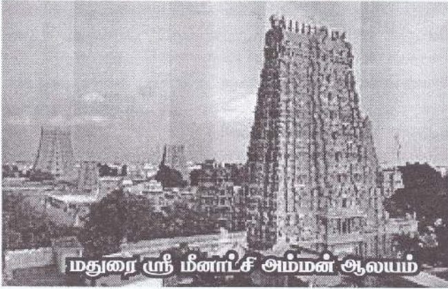
மதுரை ஸ்ரீ மீனாட்சி அம்மன் ஆலயம்

மதுரை ஸ்ரீ மீனாட்சி அம்மன் ஆலயத்தின் கோபுரங்கள் வரலாற்றுப் புகழோடு கலைச் சிறப்புப் பெற்று விளங்குகின்றன. அம்பிகையின் ஆலயத்திற்குமுன் அமைந்து விளங்கும் கோபுரம் ஏழுநிலைக் கோபுரமாகும். 740 சுதை விகிரகங்களைக் கொண்டது. ஏறக்குறைய 117 அடி உயரமுள்ளது. கோபுரத்தின் அடிப்பகுதி 78 அடிநீளமும் 38 அடி அகலமும் கொண்டது. எண்ணற்ற கலையெழில் கொண்ட சிற்பங்களினால் அது 'சித்திரக் கோபுரம்' என அழைக்கப்படுகின்றது. இக்கோயிலின் நாற்புறமும் நான்கு கோபுரங்கள் அலங்காரத்துடன் காட்சிதருகின்றன. ஒவ்வொன்றும் ஒன்பது நிலைகளைக் கொண்டது. இப்பிரதான கோபுரங்களுள் தென்வாயிலில் உள்ள கோபுரமே உயரத்தில் கூடியது. நிமையட்டத்திலிருந்து 160 அடி உயரமுள்ளது. கோபுரத்தின் அடிப்பகுதி 108 அடிநீளமும் 67 அடி அகலமுடையது. ஏறக்குறைய 1124 சுதைச்