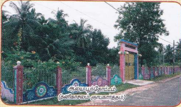
ஆலய பூந்தோட்டம் (குனிகாசலம் ஞாபகார்த்தம்)