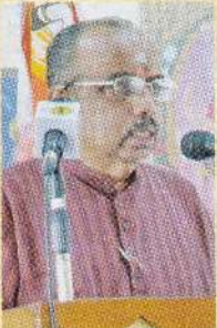
மாமன்றத் தலைவரின் தலைமையுரை