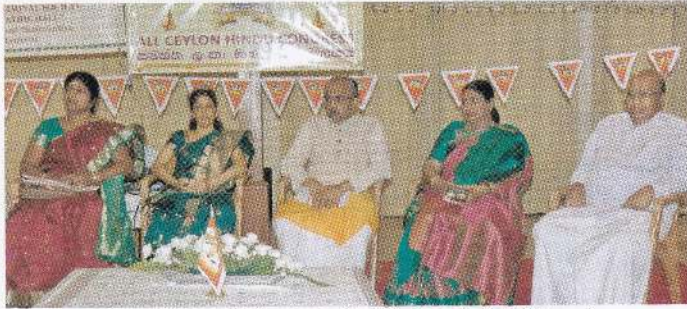
மேடையில் அமர்ந்திருக்கும் விருந்தினர்களும் பிரதிநிதிகளும்