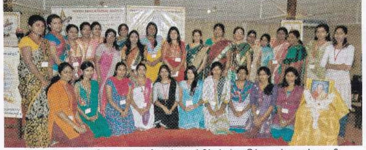
கொழும்பு மகளிர் இந்து மன்றத்தினால் ஆரம்பிக்கப்பட்ட "இந்து மங்கையர் அணி"