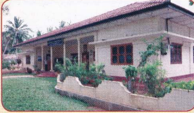
துர்க்காபுரம் மகளிர் (சிறுமிகள்) இல்லம்

தேவஸ்தானம் ஆற்றும் பன்முகப் பணிகளில் தலையாய ஓர் அறப்பணியாகக் கருதப்படுவது துர்க்காபுரம் மகளிர் இல்லப் பணியாகும். ஆதரவற்ற ஐந்து வயதுக்கு மேற்பட்ட சிறுபிள்ளைகளை ஆதரித்துக் கல்வியூட்டி, உணவுூட்டி சகல பராமரிப்பையும் மேற்கொண்டு பணி புரிவதற்கு ஆரம்பத்தில் சிறிய கட்டிடத்தில் இடம் கிடைத்தது. இவ் இல்லம் - 1982ஆம் ஆண்டு பெப்ரவரி மாதம் 3ஆம் திகதி ஆரம்பிக்கப்பட்டது. 1985ஆம் ஆண்டு சகல வசதிகளுடன் கூடிய மாடிக் கட்டிடம் கட்டப்பட்டு மகளிர் இல்ல செயற்பாடுகள் இங்கு இடம்பெற்றுவருகின்றன.