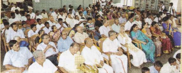
நிகழ்வில் கலந்துகொண்ட அலையேபார்