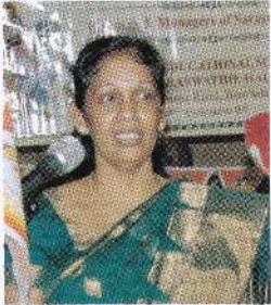
பிரதம விருந்தினர் உரை - மாண்புமிகு திருமதி விஜயகலா மகேஸ்வரன் (இராஜாங்க அமைச்சர்)