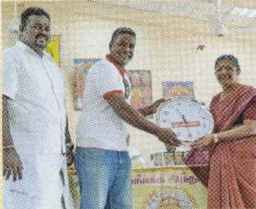
வங்காசிறி செய்தி நிறுவனத்தினால் மாமன்றத்திற்கு சுவர்க்கடிக்காரம் ஒன்று அன்பளிப்பாக வழங்கப்பட்டது.