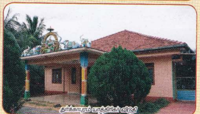
தூக்காபுரம் யாத்திரிகர் விடுதி