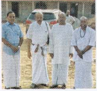
கிளிநொச்சி, முற்கண்டியில் மாமன்றத்தினால் அமைக்கப்பட்டுவரும் சரவணப்பொய்கையுடனணைந்த கட்டடப் பணிகளைப் பார்வையிடும் மாமன்றத் தூதுக்குழுவினர்.