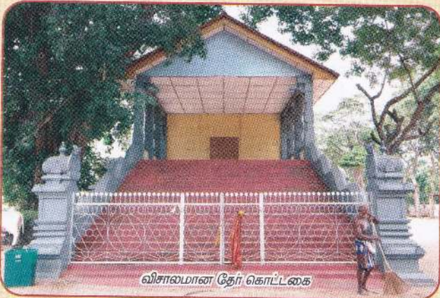
விசாலமான தேர் கொட்டகை