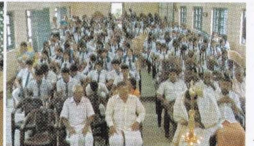
கல்முனை ஸ்ரீ இராமகிருஷ்ண மகா வித்தியாலயத்தில் இடம்பெற்ற நிகழ்வு