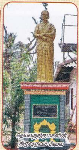
தெய்வத்திருமகளின் திருவுருவச் சிலை