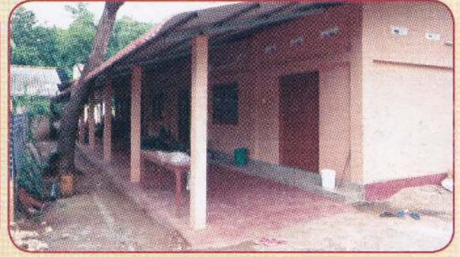
துர்க்காபுரம் மகளிர் இல்ல உணவு மண்டபம்