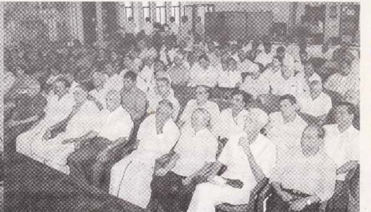
நிகழ்வுக்கு வருகை தந்தவர்களுள் ஒரு பகுதியினர்.