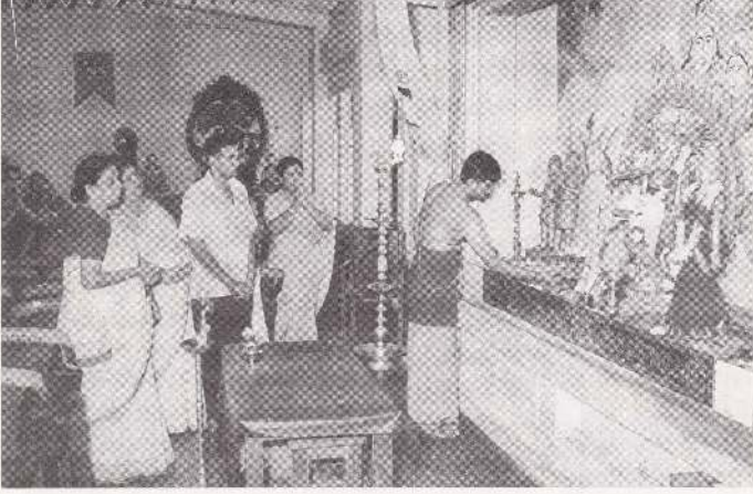
மாமன்றத்தில் பூசை வழிபாடு நடைபெறுகிறது.