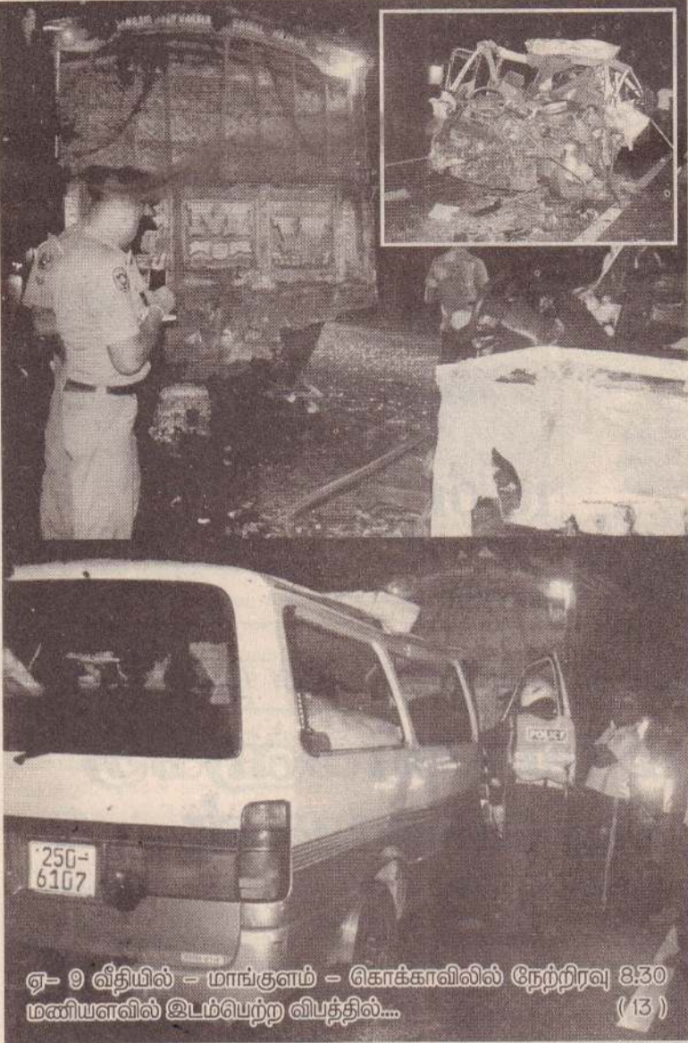
ஏ-9 வீதியில் - மாங்குளம் - கொக்காவிலில் நேற்றிரவு 8:30 மணியளவில் இடம்பெற்ற விபத்தில்...