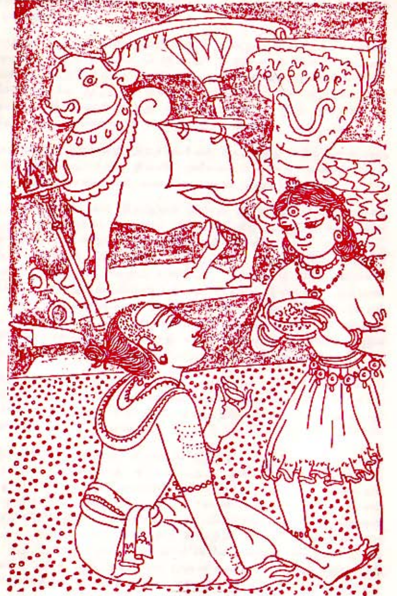
முத்துத் தாண்டவர் Muthu Thandavar

பசிப்பிணியாலும் துயராலும் விழிக்கெழுந்த தாண்டவர் அம்மை அப்பனின் திருவடிகளை நினைத்து தொழுதார். இவ்வேளையில் எம்பிராட்டியார் குழந்தைக்கு இரங்கும் தாய்போல் ஒரு சிறுபெண் குழந்தை வடிவில் இவரிடத்து பொன் வட்டியில் சாதம் சுமந்து வந்து அளித்தார். தாண்டவரின் பசிப்பிணி தீரவே உடற்பிணியை