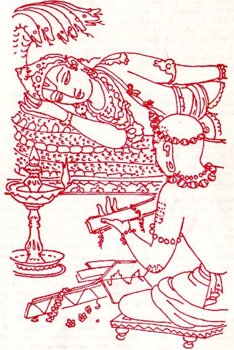
அருணாசல கவிராயர் Arunachala Kavirayar