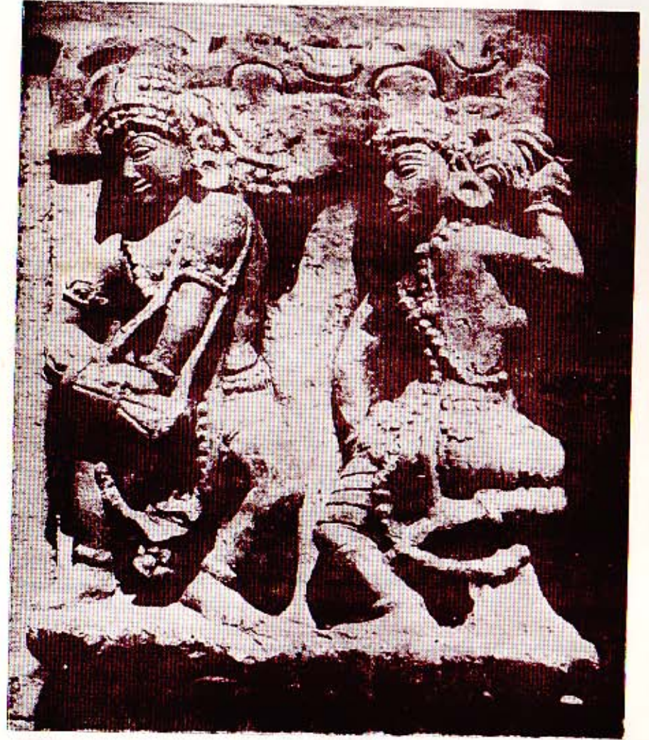
Dancing couple at Doddabasappa Temple, Dambal (Karnataka)

நாம் இன்று சாதாரணமாக இந்திய இசை வழக்கினை எடுத்து நோக்குமிடத்து அது இரு பெரும் கூறுகளைத் தன்னகத்தே கொண்டுள்ளது. ஒன்று வட - இந்திய இசைத்துறை, வட - இந்திய இசைத்துறையானது இந்துஸ்தானிய சங்கீதமென்றும் மற்றையது கர்நாடக சங்கீதத்துறை எனவும் பிரிக்கப்பட்டுள்ளது. இப்பிரிவானது கி. பி: 13 ஆம் நூற்றாண்டிற்குப் பிற்பட்ட காலப்பகுதியிலேயே இரண்டாகப் பிரிந்து வளர்ச்சியடையத் தொடங்கியது: