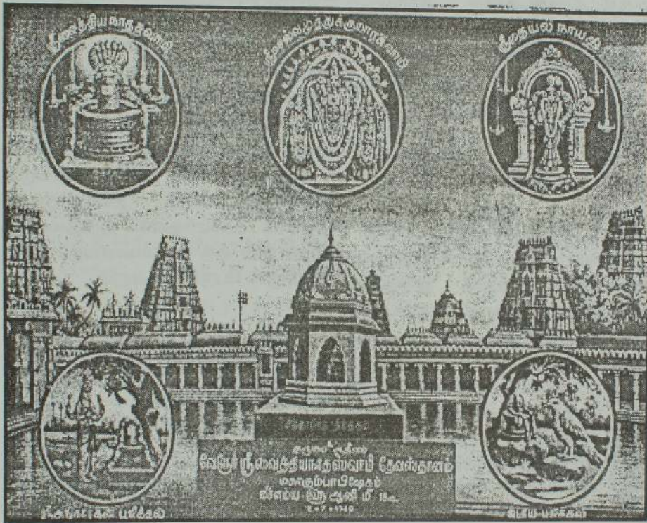
ஸ்ரீ வைத்தீஸ்வரசுவாமி திருக்கோவில்

திற்கு எதிரே இருக்கின்றது. சித்தர் கணம் இறைவர் திருமுடியில் அமிர்தத்தால் அபிஷேகித்த போது, அவ்வமிர்தம் வந்து இத்திருக்குளத்தில் கலந்தமையால் இது சித்தாமிர்த தீர்த்தம். என அழைக்கப்படுகிறது.