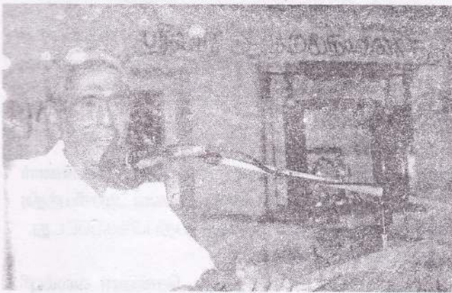
பிரதமவிருந்தினர் திருமதி ச.காங்கேயன் பரிசில் வழங்குகின்றார்.