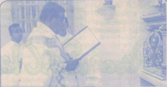
புனர்நிரமாணம் செய்யப்பட்ட யாழ் ஆயர் இல்ல சிற்றாலயம் ஆசீர்வதித்துத் திறந்து வைப்பு