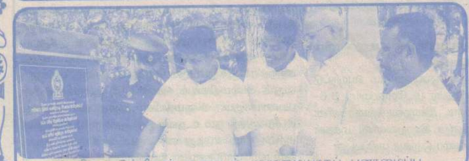
புனித மடுத்தினர் குருமடம் முழுமையாகப் புனர்மைப்பு