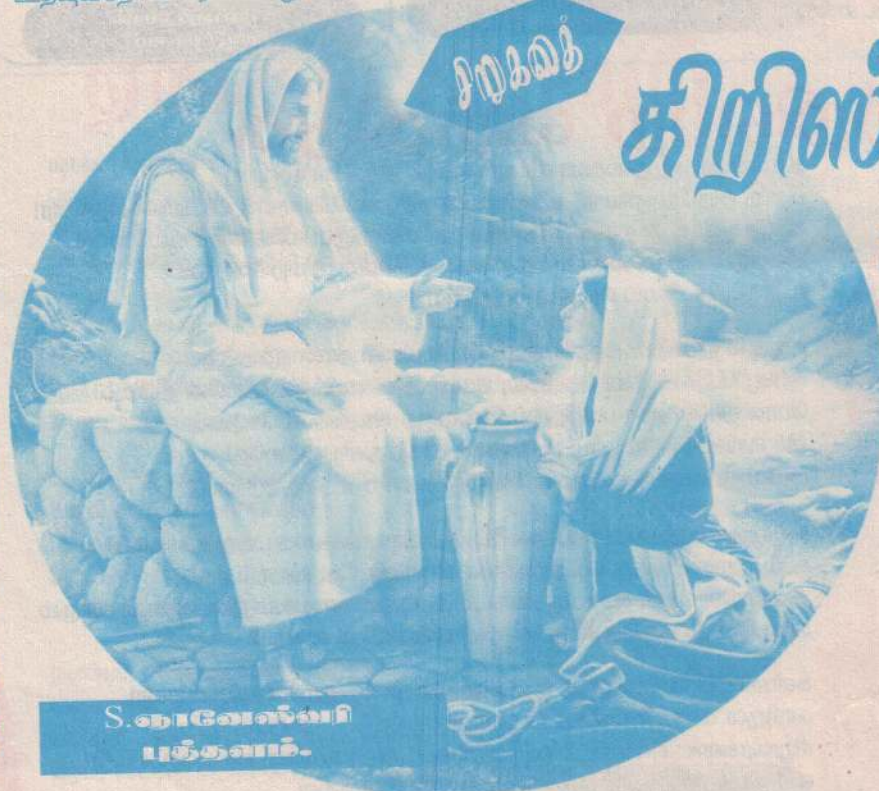
S. சுவாஸல்பி புக்தவம்.

அப்பா அர்த்தத்துடன் தன் பிள்ளைகளைத் திரும்பிப் பார்க்க, அவர்கள் புரிந்த தினுசில் தலையாட்டியபடி மகிழ்வுடன், நிறைந்த மனதுடன் தங்கள் தந்தையைப் பின் தொடர்ந்தனர்.