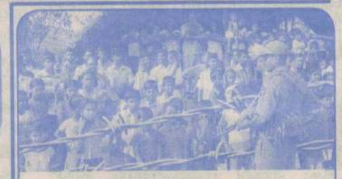
஁ழப்பெருந்துயரின் 10 ஆம் ஆண்டு நினைவு