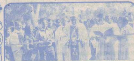
கிளிநொச்சியில் சதாசகாய அன்னை ஆலயம் யாழ் ஆயரால் திறந்து வைப்பு