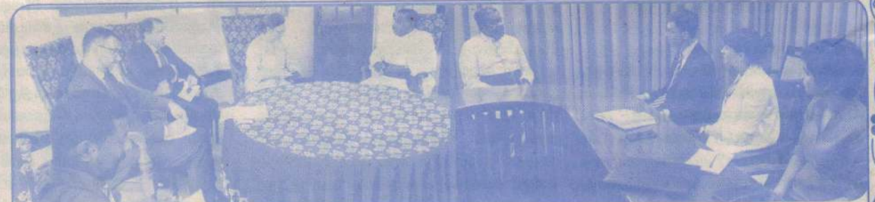
அமெரிக்கத் தூதுவர், பிரித்தானிய தூவர் யாழ் ஆயரைச் சந்தித்தவேளை...