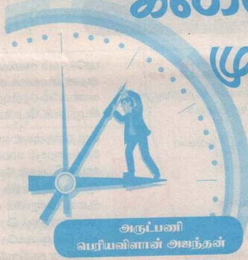
அருப்பலி பெரியவிலாள் அலங்காரம்

அந்தக் கூட்டத்தில் தன் சாரத்தை வழக்கத்தைவிட சற்று மேலாகவே உயர்த்திக்கட்டிய ஒருவர். வெற்றிலை பாக்குப் போட்டுத் துப்பிய தன் வாயை புறங்கையால் துடைத்தபடி சத்தமாகச் சொல்லிக் கொண்டிருந்தார். "கடைசியாக முகம் பாக்கிராக்கள் பாருங்கோ". எனக்கு நெஞ்சுக்குள் ஏதோ வந்து அடைத்தது. இதயம் வேகமாக அடித்துக் கொண்டது. கடைசியாக முகம் பாக்கிராதென்றால் என்ன? இனி இந்த முகத்தை ஒருபோதும் பார்க்கமுடியாதா? என் விடுமுறை நாட்களில் என்னைப் பார்ப்பதற்காக சைக்கிளில் வந்து என்னைக் கட்டி அணைத்து தன்