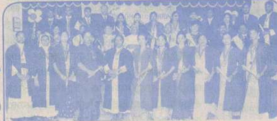
அகவொளி நிறுவனத்தின் உள ஆற்றுப் படுத்தல் டிப்ளோமா பட்டமளிப்பு விழா