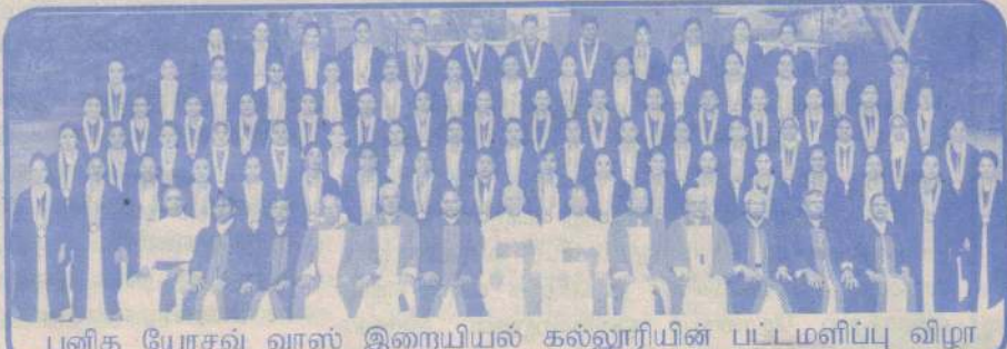
புனித யோசவ் வாஸ் இறையியல் கல்லூரியின் பட்டமளிப்பு விழா