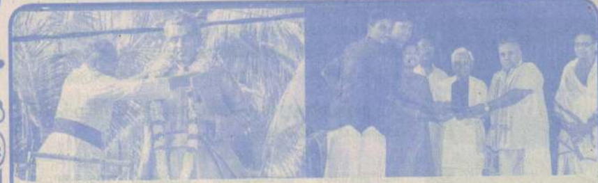
யாழ்ப்பாணத்தில் இடம்பெற்ற தனிநாயகம் அடிகள் நினைவுரங்கம்