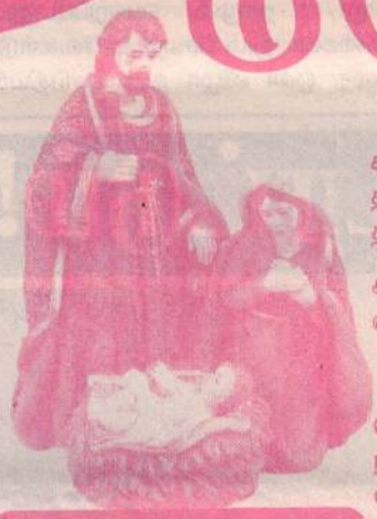
அருட்பவி. M.நியலாச (சச.தா)

கால சூழ்நிலைக்குள் தவித்தார்கள். எனவே தான் உலகினரின் வாழ்வில் நம்பிக்கை தீமாய் நம் மத்தியில் கிறிஸ்து உதித்தார்.