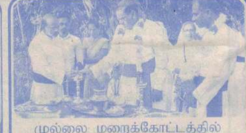
முல்லை மறைக்கோட்டத்தில் அன்புக் கன்னியர் சபை அருட்சகோதரிகளின் இல்லம்