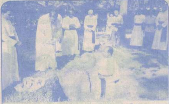
சமூகத் தொடர்பு ஆணையத்திற்கான புதிய கட்டட அடிக்கல் நாட்டல் நிகழ்வு