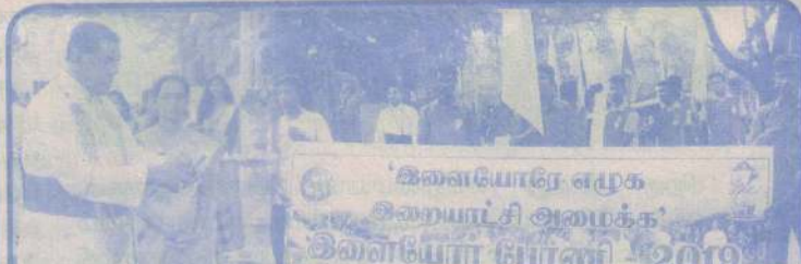
இளையோர் ஆண்டின் சிறப்பு நிகழ்வு