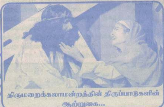
திருமறைக்கலாமன்றத்தின் திருப்பாடுகளின் ஆற்றுகை...