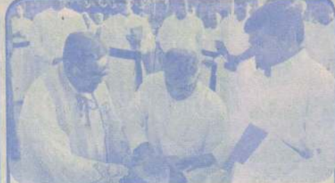
அல்லைப்பிட்டியில் மொன்போர்ட் சர்வதேச பாடசாலைக்கு அடிக்கல்