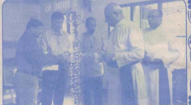
கத்தோலிக்க சட்டத்தரணிகள் சங்கம் அங்குரார்ப்பணம்