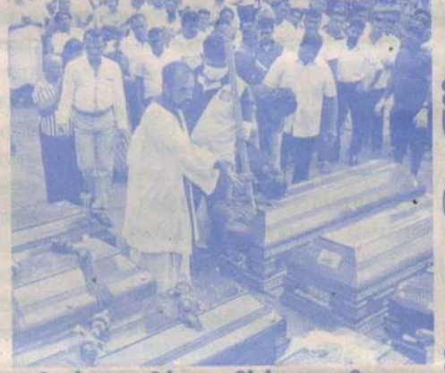
மனிகம் மரணிக்க உயிர்த்த ஁யிறு

கிறித்தவ நெஞ்சம் மறப்பதில்லை. சாதிமீன் கலந்திருக்கின்றன. மதங்கள் ஒழுரேயுள்ளன. தினங்கள் அகலுகே ட்டுமக் கிடக்கின்றன. கிறிஸ்தவர்கள் மெய்த்திருத்தலால் கிறித்தவர்களின் 'சினம்' என்஁தை கடந்த ஁ர் உயிரில்லன் பிரகடனத்துக்கு கிட்டும் செல்லும் என்஁ணர்வாம். ஆதும் சாத்தியம் பிரார்த்தனை மெய். துயில் சேர்க்கும் கிறித்தவர்கள் கிறித்தவர்களே வேண்டாம்