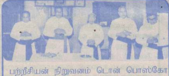
பற்றச்சியன் நிறுவனம் டொன் பொஸ்கோ சபைக் குருக்களினால் பொறுப்பேற்பு