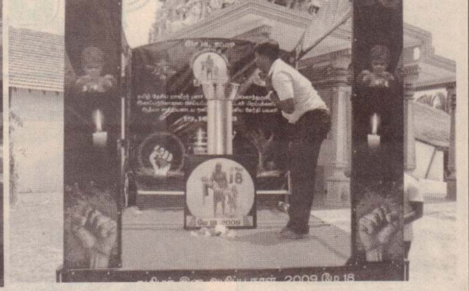
மாகாணத்தின் அனைத்து மாவட்டங்கள் ஊடாகவும் பயணித்து, நாளைமறுதினம் முள்ளிவாய்க்கால் மண்ணைச் சென்றடைய