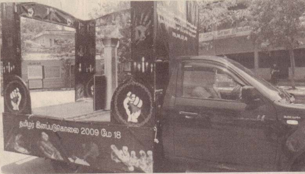
வல்வெட்டித்துறை, மே 16 முள்ளிவாய்க்கால் இனப்படுகொலையை வெளிச்சம் போட்டுக் காட்டும் தீப ஊர்