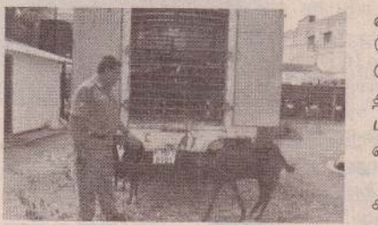
கைது செய்யப்பட்ட நபர் புத்தளத்தைச் சேர்ந்த 54 வயதானவர் என தெரிய

வவுனியா, மே.16 கிளிநொச்சி பகுதியிலிருந்து உரிய ஆவணங்கள் இன்றி 61 ஆடுகளை கடத்திச் சென்ற நபரொருவரை பொலிஸார் கைது செய்துள்ளனர். குறித்த நபரை வவுனியா - நொச்சி மோட்டை பாலத்தில் வைத்து பொலிஸார் நேற்று அதிகாலை கைது செய்ததுடன், ஆடுகளை கொண்டு செல்ல பயன்படுத்திய வாகனத்தையும் கைப்பற்றியுள்ளனர்.