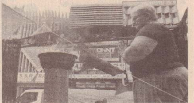
வவுனியா, மே 18

வவுனியாவை வந்தடைந்த முள்ளிவாய்க்கால் நினைவேந்தல் தீபமேந்திய ஊர்தி நேற்று பிற்பகல் வேளை பசார் வீதியில் பொதுமக்கள் மற்றும் வர்த்தக நிலையங்களிலுள்ள வர்த்தகர்கள் சுடர் ஏற்று