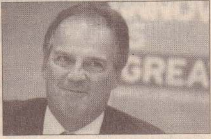
கொழும்பு, மே 18

சர்வதேச கடப்பாடுகளை நிறைவேற்றும் விடயத்தில் இலங்கையின் வேகம் போதாது என்று பிரித்தானியா ஏமாற்றம் வெளியிட்டுள்ளது. பிரித்தானிய அமைச்சர் மார்க் பீல்ட் இதனை தெரிவித்துள்ளார். லண்டனில் இடம்பெற்ற பொது நலவாய மாநாட்டின் போது இலங்கை வெளிவிவகார அமைச்சருடன்