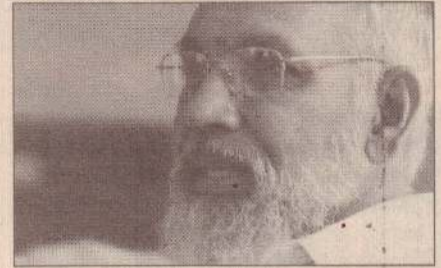
யாழ்ப்பாணம், மே 18

போர்க் குற்றம் தொடர்பாக உள்ளக விசாரணைகள் மட்டும் போதுமானது என்று நல்லிணக்க அமைச்சர் மனோ கணேசன் கூறியிருப்பது அவரது அரசியல் காரணங்களுக்காகவே என்று வட மாகாண முதலமைச்சர் க.வி.விஜி தேனாச்சுரி தெரிவித்துள்ளார்.