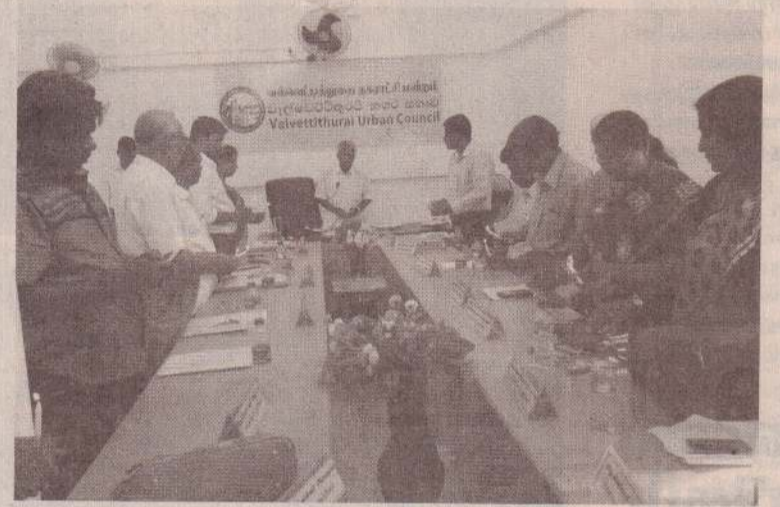
முள்ளி வாய்க்கால் நினைவேந்தலை முன்னிட்டு நேற்று வியாழக் கிழமை பிற்பகல் 4 மணியளவில் வல்வெட்டித் துறை நகரசபை மண்டபத்தில் நகரசபை தவிசாளர், உபதவிசாளர் மற்றும் நகரசபை உறுப்பினர்கள் சகிதம் மெழுகுவர்த்தி ஏற்றி அஞ்சலி செலுத்தினார்கள்.