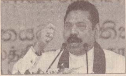
கொழும்பு, மே 18

நாட்டுக்காக தமது உயிர்களை தியாகம் செய்த இராணுவ வீரர்களை நினைவு கூர்வது மக்கள் அனைவரதும் கடமையாகும் என முன்னாள் ஜனாதிபதி மஹிந்த ராஜபக்ஷ தெரிவித்துள்ளார். யுத்தத்தின்போது நாட்டுக்காக உயிர் தியாகம் செய்த ஒவ்வொரு வீரர்களையும் அதன்போது உயிர்த்த மக்களையும் நினைவு கூர்வதற்கான தினம் மிகவும் அவசியமாகும் என அவர் சுட்டிக்காட்டி