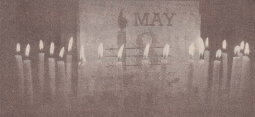
யாழ்ப்பாணம், மே 18

முள்ளிவாய்க்கால் படுகொலை நாள் நினைவேந்தல் நிகழ்வு இன்றைய தினம் பேரெழுச்சியுடன் முள்ளிவாய்க்காலில் மேற்கொள்ளப்படவுள்ளது. முள்ளிவாய்க்கால் படுகொலைகளின் 9 ஆவது ஆண்டு நிறைவை முன்னிட்டு, மே 18ஆம் நாளை, துக்கநாளாகவும், தமிழினப் படுகொலை நாளாகவும் வடக்கு மாகாண சபை பிரகடனம் செய்துள்ளது. தமிழினப் படுகொலைகள் இடம்பெற்ற முள்ளிவாய்க்கால் மண்ணில் வழக்கம் போலவே, இன்று பாரிய நினைவேந்தல் நிகழ்வுக்கான ஏற்பாடுகள் மேற்கொள்ளப்பட்டுள்ளன.