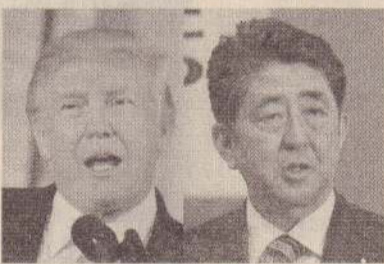
வொஷிங்டன், மே 30

வடகொரியாவின் அணு ஆயுதங்கள் கட்டாயம் அழிக்கப்பட வேண்டும் என அமெரிக்க ஜனாதிபதி டொனால்ட் ட்ரம்ப், ஜப்பான் பிரதமர் ஷின்சோ அபே ஆகியோர் தெரிவித்துள்ளனர்.