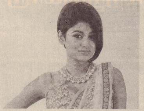
சென்னை, மே 30

பிக்பாஸ் நிகழ்ச்சியின் இரண்டாம் பாகம் எதிர்வரும் 11ஆம் திகதி தொடங்கப்பட உள்ளது. இந்த நிகழ்ச்சியையும் நடிகர் கமல் ஹாசனே தொகுத்து வழங்க உள்ளார். பிக்பாஸ் - 2 இல் பங்கேற்கவிருப்பவர்கள் யார் என்ற பரபரப்பான எதிர்பார்ப்பு நிலவி வரும் நிலையில், நடிகை ஓவியா அதில் கலந்து கொள்ளப்போகிறார் என்று சில ஊடகங்கள் தெரிவித்துள்ளன.