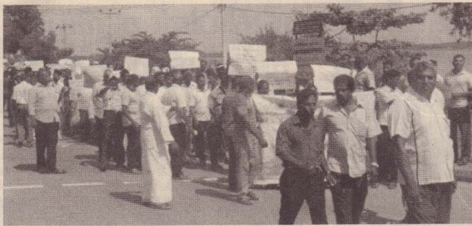
மட்டக்களப்பு, மே 31

மட்டக்களப்பு நீர்ப்பாசனத் திணைக்களத்தின் செயற்பாடுகளைக் கண்டித்து, உன்னிச்சைக் குளம் நீர்ப்பாசனத் திட்ட விவசாயிகள் போராட்டம் ஒன்றை முன்னெடுத்தனர்.