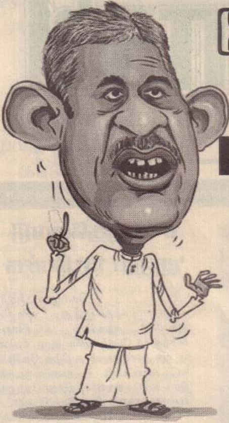
கொழும்பு, மே 31

ஐக்கிய தேசியக் கட்சி இணங்கினால் கோத்தபாய ராஜபக்சவுக்குச் சவாலாக, நாள் ஜனாதிபதி வேட்பாளராக களமிறங்கத் தயாராக உள்ளேன் என்று சரத் பொன்சேகா தெரிவித்துள்ளார்.