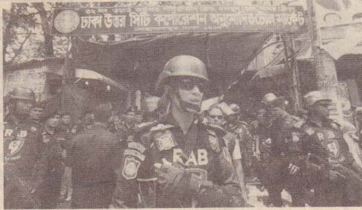
டாக்கா, மே 31 பங்களாதேஷில் அதிகரித்து வரும் போதை மருந்து உபயோகத்தைக் கட்டுப்படுத்தும் அரசின் நடவடிக்கையில், இதுவரை 105 பேர் சுட்டுக்கொல்லப்பட்டனர்.

பங்களாதேஷில் 'யாபா' எனப்படும் தடை செய்யப்பட்ட போதை மருந்துகளின் பயன்பாடு அதிகரித்துள்ளது. அண்டை நாடான மியன்மாரில் இருந்து இந்தப் போதை மருந்துகள் கடத்தப்பட்டு விற்கப்படுகிறது. போதை மருந்து விற்பனையாளர்கள் அதிகம் இளைஞர்களையே குறிவைப்பதாகவும் தெரிவிக்கப்பட்டுள்ளது. இந்த வகை போதை மருந்துகளை ஒழிக்க அந்த நாட்டு அரசு பல்வேறு வழிகளில் முயற்சித்து வருகிறது. அந்த நாட்டுப் பிரதமர் ஷேக் ஹசீனாவின் உத்தரவின் அடிப்படையில், ஆயிரக்கணக்கான போதை மருந்து வியாரிகள் கைது செய்யப்பட்டுள்ளனர்.