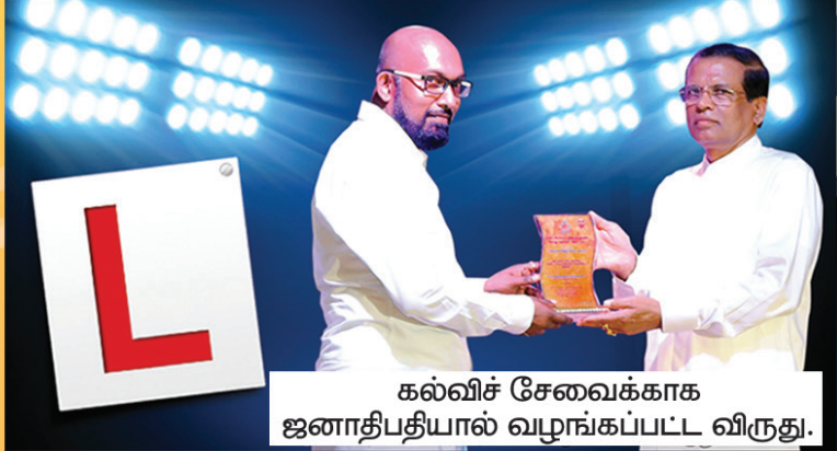
கல்விச் சேவைக்காக ஜனாதிபதியால் வழங்கப்பட்ட விருது.

021 222 4353, 021 492 3200, 071 454 6960