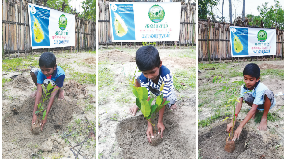
‘சுவாசம்’ நிறுவனத்தின் ஏற்பாட்டில் காரைநகரில் நேற்று மர நடுகை ஆரம்பித்து வைக்கப்பட்டது. ‘தாயகத்தில் கிராமங்களை பசுமையாக்குவோம்’ எனும் கருப்பொருளில் நடைபெற்ற இம் மர நடுகை நிகழ்வில் சிறுவர்கள் மர நடுகை செய்வதை படங்களில் காணலாம்.