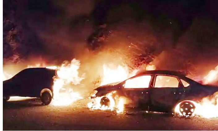
இந்தச் சம்பவத்தால் அப்பகுதியில் பெரும் பரபரப்பு ஏற்பட்டுள்ளமை குறிப்பிடத்தக்கது. (ஐ)

இந்த நிலையில் தீ வைக்கப்பட்ட வாகனங்களில் 8 இரு சக்கர வாகனங்களும், 2 கார்களும் முற்றிலும் எரிந்து சேதமாகியுள்ளன. மேலும் 6 மோட்டார் சைக்கிள் மற்றும் 2 கார்கள் என்பவை பாதி எரிந்த நிலையில் காணப்பட்டுள்ளன.