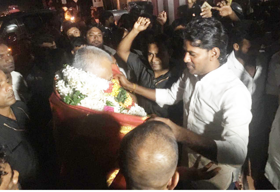
வவுனியா, நவ. 10 புதிய அரசில் வடக்கு அபிவிருத்தி, புனர்வாழ்வு, புனரமைப்பு மற்றும் இந்துவிவகார அமைச்சராகப்

பதவியேற்றிருக்கும் அமைச்சர் டக்ளஸ் தேவானந்தாவுக்கு நேற்று முற்பகல் வவுனியா மாவட்டத்தில் சிறப்பான வரவேற்பளிக்கப்பட்டது.