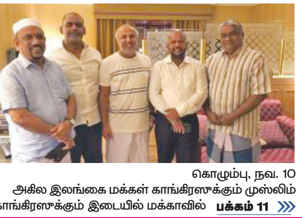
கொழும்பு, நவ. 10 அகில இலங்கை மக்கள் காங்கிரஸுக்கும் முஸ்லிம் காங்கிரஸுக்கும் இடையில் மக்காவில் பக்கம் 11 >>>