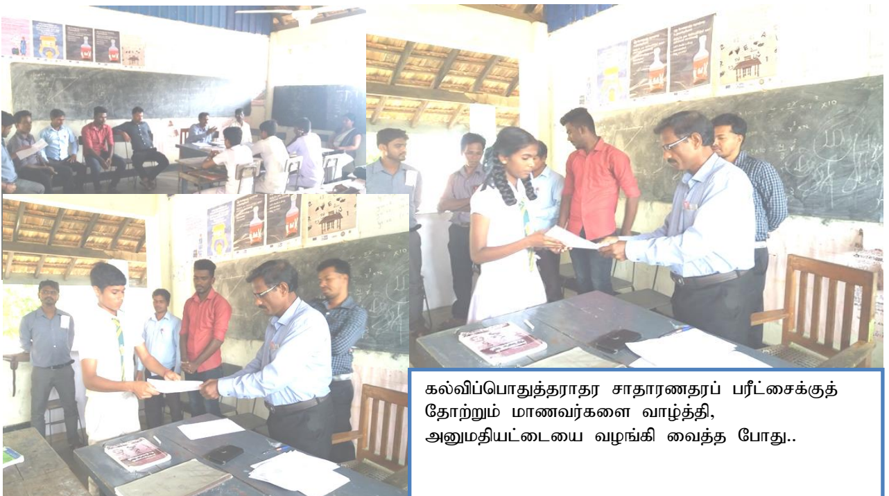
கல்விப்பொதுத்தராதர சாதாரணதரப் பரீட்சைக்குத் தோற்றும் மாணவர்களை வாழ்த்தி, அனுமதியட்டையை வழங்கி வைத்த போது..