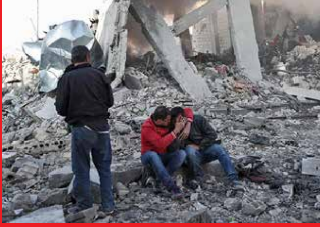
குடிமக்கள் கொல்லப்பட்டனர். இந்த தாக்குதலை அடுத்து 4 லட்சத்திற்கும் கூடுதலான மக்கள் தங்களது வீடுகளை விட்டு விட்டு இடம் பெயர்ந்து சென்றனர்.

இப்பகுதியில் கடந்த ஏப்ரலில் நடந்த அரசு ஆதரவு படைகளின் தாக்குதலில் ஆயிரத்திற்கும் மேற்பட்ட