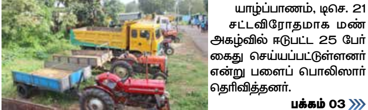
யாழ்ப்பாணம், டிசெ. 21 சட்டவிரோதமாக மண் அகழ்வில் ஈடுபட்ட 25 பேர் கைது செய்யப்பட்டுள்ளனர் என்று பளைப் பொலிஸார் தெரிவித்தனர். பக்கம் 03 >>>