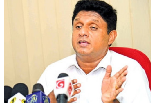
சஜித் தரப்பு இறங்கியுள்ளது.

தனது ஆதரவு எம்.பிக்களுடன், தமிழ் முற்போக்குக் கூட்டணி, தமிழ் தேசியக் கூட்டமைப்பு, முஸ்லிம் காங்கிரஸ், அகில இலங்கை மக்கள் காங்கிரஸ் ஆகியனவற்றையும் இணைத்து கூட்டணியாகக் களமிறங்கும் பேச்சுக்களில்