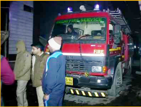
கிடைக்கவில்லை. ஆனால் திடீரென ஏற்பட்ட எரிவாயு சிலிண்டர் வெடிப்பே காரணம் என்று ஊடகச் செய்தி ஒன்று தெரிவித்தது.

தீ விபத்து ஏற்பட்டதற்கான காரணம் குறித்து இன்னும் முழுமையான தகவல்கள்