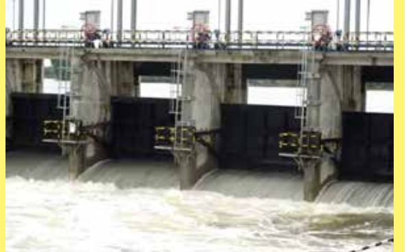
தாழ்நில பகுதிகளில் உள்ள மக்களை அவதானத்துடன் செயற்படுமாறும் இடர் முகாமைத்துவ நிலையம் கேட்டுக்கொண்டுள்ளது. (ஐ)

அத்துடன் குளத்தின் அடைவு மட்டம் தொடர்ந்தும் அவதானிக்கப்பட்டு வருவதாகவும், நீர்வருகை அதிகரிக்கும்பட்சத்தில் வான் கதவுகள் மேலும் திறந்து விடப்படும் எனவும் அறிவிக்கப்பட்டுள்ளது.