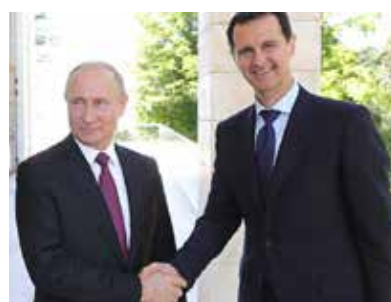
பழையமையான (Mariamite) தேவாலயம் ஆகியவற்றுக்கும் சென்று பார்வையிட்டார்.

தலைநகர் டமாஸ்கஸுக்கு தனி விமானத்தில் வந்த புடினுக்கு உற்சாக வரவேற்பு அளிக்கப்பட்டது. இதையடுத்து சிரியா அதிபர் அல் ஆஸாத் சந்தித்து பேசிய புடின், பின்னர் அவருடன் சேர்ந்து 8ஆம் நூற்றாண்டில் கட்டப்பட்ட மசூதி மற்றும் மிகவும்