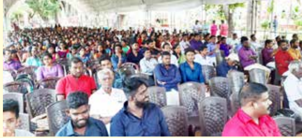
னால் வருடாந்தம் நடத்தப்படும் இவ்விழா இவ்வருடம் 'மொழிதனைக் கடையும் இளையவர் பயணம்' என்ற தொனிப் பொருளில் இடம்பெறுகிறது. யாழ்ப்பாண பல்கலைக்கழகம் நோக்கிய எழுச்சிப் பேரணியுடன் நிகழ்வுகள் நேற்றுக் காலை ஆரம்பமாகின. இதன்போது, தமிழர் கலாசார - பண்பாட்டு அடையா