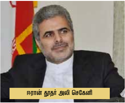
ஈரான் தூதர் அலி செகேனி

உலகில் அமைதியை நிலைநாட்டுவதற்கு இந்தியா மிகச்சிறந்த பங்கு வகிக்கிறது. அதே நேரத்தில் இந்தியா இந்தப் பிராந்தியத்தில் உள்ளது.