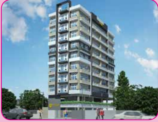
19 BOSWELL PLACE, COLOMBO : 06