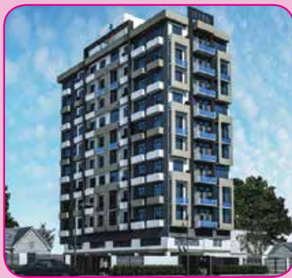
22 VIVEKANANDA RD, COLOMBO : 06