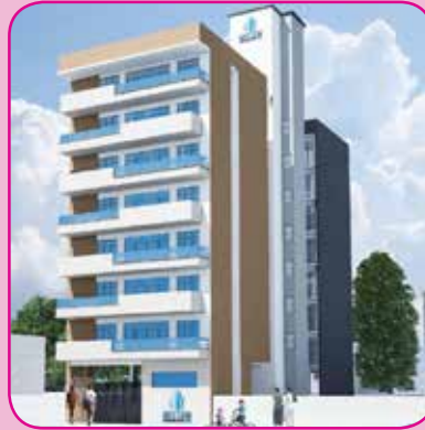
61, 37TH LANE, COLOMBO : 06