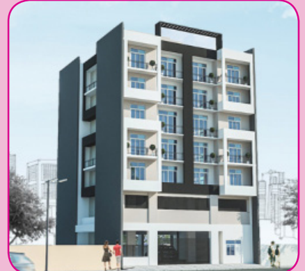
23,40TH LANE, COLOMBO : 06