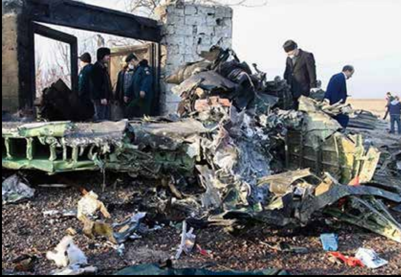
தெஹ்ரான், ஜன. 08

ஈரானில் நேற்றுக் காலை நடந்த உக்ரைன் விமான விபத்தில் அதிலிருந்த 176 பயணிகளும் உயிரிழந்து உள்ளனர்.