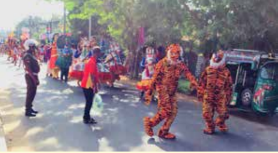
யாழ்ப்பாணம், ஜன. 09 யாழ்ப்பாண பல்கலைக்கழக மாணவர் ஒன்றியத்தினால் ஏற்பாடு செய்யப்பட்ட தமிழமுதம் நிகழ்வு பல்கலைக்கழக பிரதான வளாகத்தில் நேற்றுக் காலை ஆரம்பமாகியது. யாழ்ப்பாண பல்கலைக்கழக மாணவர் ஒன்றியத்தினால்