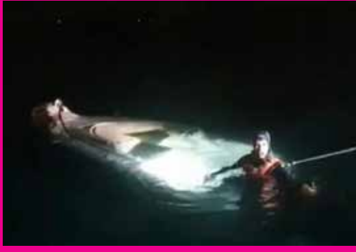
அங்காரா, ஜன. 14

துருக்கியில் படகு மூழ்கிய கோர விபத்தில் சிக்கி 11 அகதிகள் உயிரிழந்தனர்.