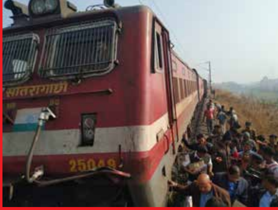
3 பெட்டிகள் தண்டவாளத்தில் இருந்து தடம் புரண்ட நிலையில் நின்றன. காயமடைந்த பயணிகள் கட்டாக் மருத்துவமனையில் சேர்க்கப்பட்டுள்ளனர்.

அடர்ந்த மூடுபனி காரணமாக சிக்னல் மாறி வந்த ரயில், சரக்கு ரயில் ஒன்றின் காட்டு பெட்டியில் மோதியதால் விபத்து ஏற்பட்டதாக முதற்கட்டத் தகவல்கள் தெரிவிக்கின்றன. விபத்தில் 5 பெட்டிகள் தண்டவாளத்தில் இருந்து முழுமையாக விலகிக் கவிழ்ந்தன.