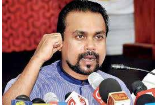
மன்னார், ஜன. 19

அதிகாரம் உள்ள நாடாளுமன்றம் ஒன்றை அமைப்பதே எமது நோக்கம் என அமைச்சர் விமல் வீரவன்ஸு தெரிவித்தார்.