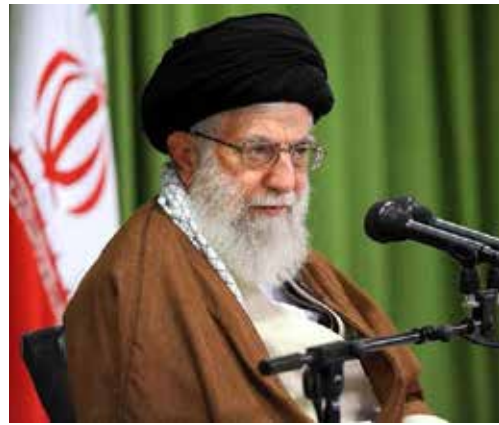
ஈரான் தலைவர் அயதுல்லா அலி காமேனி காட்டம்

தெஹ்ரான், ஜன.19 ஐரோப்பிய நாடுகள் அமெரிக்காவின் எடுபிடிகள். அவை ஈரான் சரணடைய காத்திருக்கின்றன என ஈரான் தலைவர் அயதுல்லா அலி காமேனி கூறி உள்ளார்.