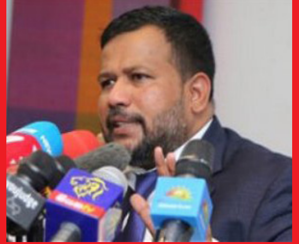
கின்ற ஒரு நிலை வரவேண்டுமாக இருந்தால் அடுத்த தேர்தலில் மக்கள் சிந்தித்து வாக்களிக்க வேண்டிய தேவை இருக்கின்றது - என்றார். (ஐ)

எனவே எதிர்காலத்தில் ஓர் இனக்கலவரம் வந்து விடாமல் எல்லோரும் சகோதரத்துவத்துடனும் சமாதானமாகவும் எல்லா உரிமைகளும் பெற்று வாழ்