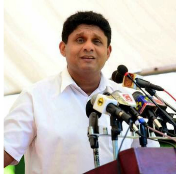
முற்பட்டுக்கொண்டிருக்கிறது. இதற்குத்தான் மூன்றில் இரண்டு பெரும்பான்மையை இவர்கள் கோருகிறார்கள். இதுதான் இவர்களின் நோக்கமாகவும் காணப்படுகிறது - என்றார்.

அதைவிடுத்து, மக்களுக்கு வாக்குறுதி அளிக்காத, மக்களை மூட்டாளாக்கும் வகையில், சுயாதீன ஆணைக்குழுக்களை இல்லாது செய்யவே அரசு