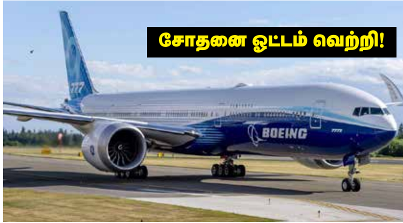
777 எக்ஸ்' விமானம் முதல் சோதனை ஓட்டத்தை வெற்றிகரமாக நிறைவு செய்தது.

அந்த நகரில் உள்ள பெயின் ஓடுதளத்தில் இருந்து புறப்பட்ட விமானம் 4 மணி நேர பயணத்துக்கு பிறகு பத்திரமாக தரையிறங்கியது. இதன் மூலம் 'போயிங்