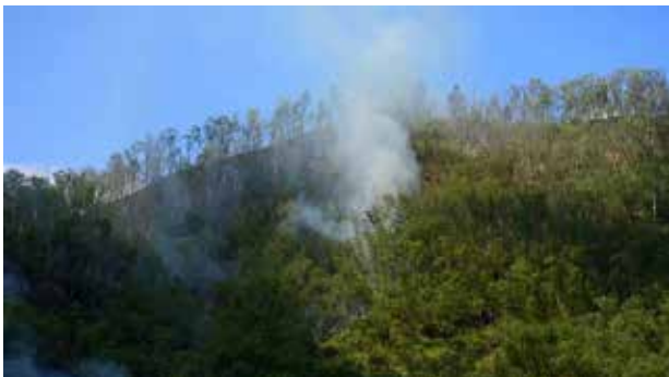
ஏற்பட்ட தீ தொடர்ந்து இரண்டு நாட்களாக

தீ ஏற்பட்டதற்கான காரணம் இதுவரை தெரியவரவில்லை.