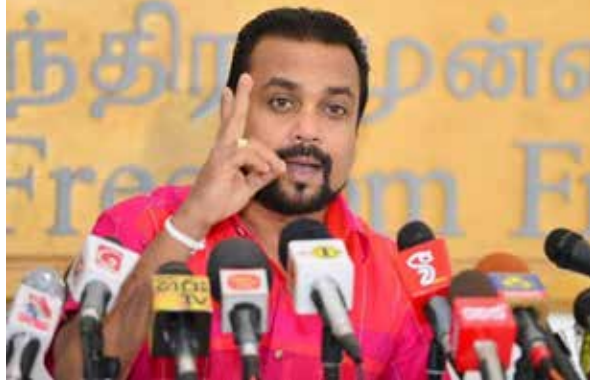
பொறுப்பு என்ற விதத்தில் அவர்களின் கோஷங்கள் அமைகின்றன.

காணாமல் ஆக்கப்பட்டோருக்கு ராஜபக்ஷாக்கள்தான்