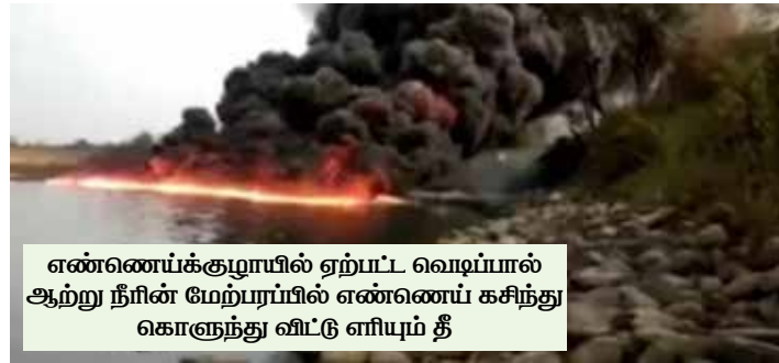
எண்ணெய்க்குழாயில் ஏற்பட்ட வெடிப்பால் ஆற்று நீரின் மேற்பரப்பில் எண்ணெய் கசிந்து கொளுந்து விட்டு எரியும் தீ

அசாம் மாநிலத்தில் எண்ணெய்க் குழாயில் ஏற்பட்ட வெடிப்பின் காரணமாக, ஆற்று நீரின் மேற்பரப்பில் எண்ணெய் கசிந்து தீப்பிடித்து எரிந்து வருகிறது. தீபுரகர் மாவட்டத்திலுள்ள சோனி கிராமப் பகுதியில் ஓடும் புர்கி டைகிங் (Burhi Dihing) ஆற்றின் மேற்பரப்பு, கடந்த 3 நாட்களுக்கும் மேலாகத் தீப்பிடித்து எரிந்து வருவதாக அந்தக் கிராம மக்கள் தெரிவித்துள்ளனர்.