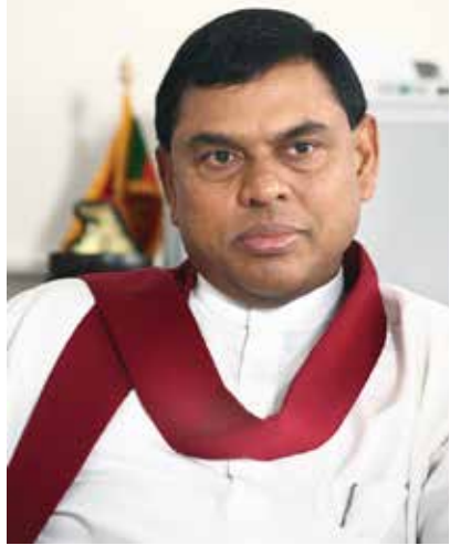
கொழும்பு, பெப். 05 மக்கள் தீர்மானிக்கும் சின்னத்தின் கீழ் ஸ்ரீலங்கா பொதுஜன பெரமுன எதிர்வரும் நாடாளுமன்றத் தேர்தலில் போட்டியிடும் என்று அந்தக் கட்சியின்

நிறுவனர் முன்னாள் அமைச்சர் பஸில் ராஜபக்ஷ தெரிவித்துள்ளார். அமெரிக்கா சென்றிருந்த பஸில் ராஜபக்ஷ சுமார் 3 மாதங்களின் பின்னர் நேற்று முன் தினம் நாடு திரும்பினார். இதையடுத்து உட்காங்களுக்குக் கருத்து தெரிவித்த அவர், மாட்சி மாதத்தில் நாடாளுமன்றம் கலைக்கப்படும் என்று ஜனாதிபதி கோட் டாபய ராஜபக்ஷ மற்றும் பிரதமர் மஹிந்த ராஜபக்ஷ ஆரம்பத்தில் கூறி யுள்ளனர். மக்களுக்கான பணிகளை இந்த அரசு நிறைவேற்றுவதற்கு பெரும் பான்மையைக் கொண்ட ஒரு வலுவான நாடாளுமன்றம் அவசியம். கடந்த ஜனாதிபதித் தேர்தலில் சுதந் தீரக் கட்சியை இணைத்து பொதுஜன பெரமுன போட்டியிட்ட நிலையில், எதிர் வரும் பொதுத் தேர்தலிலும் வெற்றி பெற, பொருத்தமான சின்னம் பயன் படுத்தப்படும் - என்றார். (ஐ)