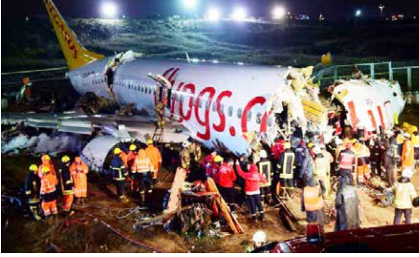
இஸ்தான்புல், பெப். 07

துருக்கியில் விமானம் தரையிறங்கும் போது ஓடுபாதையில் இருந்து சறுக்கி விபத்துக்குள்ளானது. இதில் மூன்று பயணிகள் உயிரிழந்தனர். விமானத்தில் பயணம் செய்த 183 பயணிகளில் 179 பேர் காயம் அடைந்தனர்.