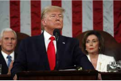
வொஷிங்டன், பெப். 07

அமெரிக்க அதிபர் டொனால்டு டிரம்ப்புக்கு எதிரான பதவி நீக்கப் பிரேரணை அமெரிக்க செனட் சபையில் தோற்கடிக்கப்பட்டது.