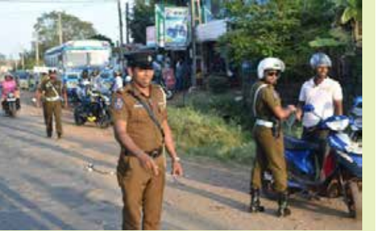
வவுனியா, பெப். 09

வவுனியா போக்குவரத்துப் பொலிஸாரின் விசேட நடவடிக்கையால் வீதி ஒழுங்குகளை மீறி வாகனம் ஓட்டிய பல சாரதிகளுக்கு எதிராக நடவடிக்கை எடுக்கப்பட்டுள்ளது.