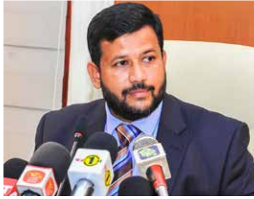
கொழும்பு, பெப். 09

பேரினவாதச் சிந்தனை கொண்டவர்கள் என்னதான் செய்தாலும் சிறுபான்மையினரின் ஆதரவின்றி ஒருபோதும் ஆட்சியமைக்க முடியாதென முன்னாள் அமைச்சர் ரிஷாத் பதியுதீன் தெரிவித்துள்ளார்.