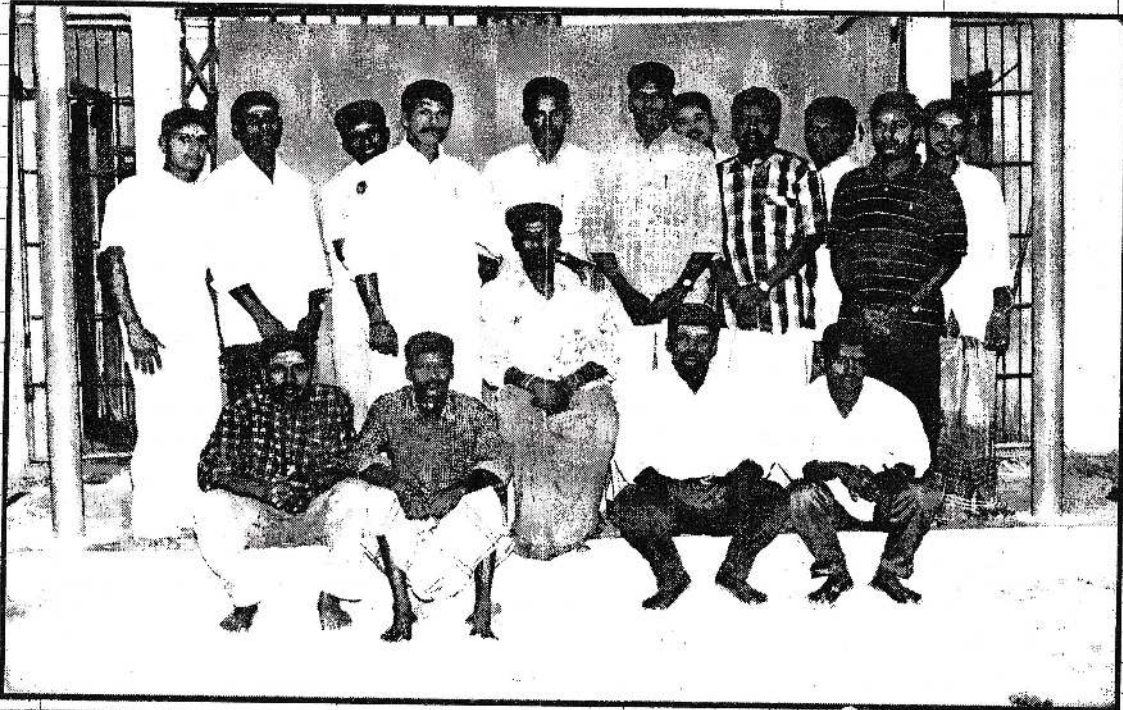
சிற்ப விக்ரகங்களை மெருகூட்டி அமைப்பதற்காக கடைசியில் வரவழைக்கப்பட்ட விசேட சிற்பாசாரிகள் குழு