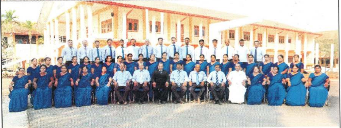
Teachers And Other Staffs