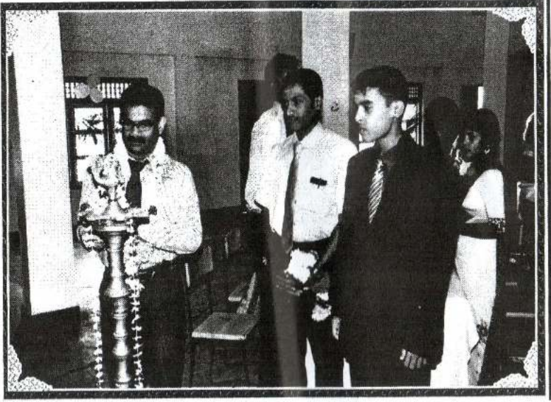
உயர்தர மாணவர் ஒன்றுகூடல்