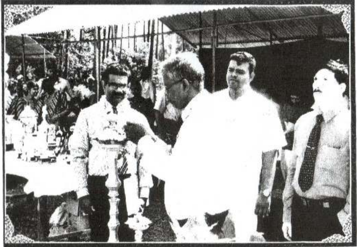
இல்ல விளையாட்டுப் போட்டி