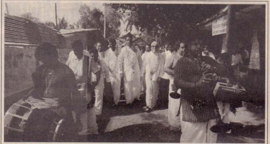
யாழ். மாநகர சபையின் கன்னியமர்வு நேற்று நடைபெற்றது. இதற்காக மாநகர சபை உறுப்பினர்கள் வரவேற்பளிக்கும்படி அழைத்துவரப்பட்டபோது...

இந்தக் குழப்பம் நீடிப்பதாலேயே மத்திய குழுக் கூட்டம் பிற்போடப்பட்டிருக்கலாம் என்று எதிர்பார்க்கப்படுகிறது. (அ)